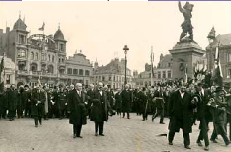
Visite du président du Conseil Raymond Poincaré pour l'inauguration du cénotaphe du Beffroi le 15 avril 1923.