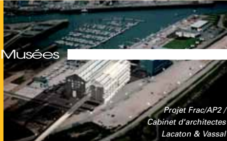
Projet Frac/AP2 / Cabinet d'architectes Lacaton & Vassal