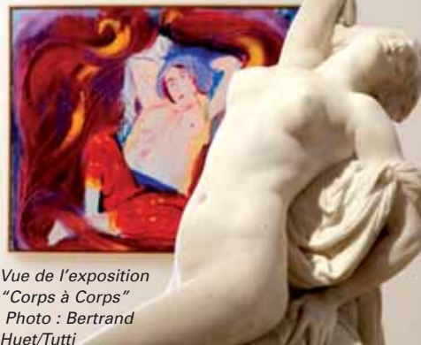
Vue de l'exposition "Corps à Corps"

Riche d'un important ensemble de peintures flamandes, hollandaises, françaises et italiennes des XVII e et XVIII e siècles (telles "L'Adoration des Mages" d'Alessandro Magnasco ou "Jeune Nègre tenant un arc" de Hyacinthe Rigaud), d'un fonds de plus de 20 000 pièces d'histoire naturelle (minéraux, animaux naturalisés...) et de près de 4 000 objets venus de tous les continents, le musée des Beaux-Arts offre une approche inédite de ses collections. L'exploration des œuvres est un cocktail d'art ancien et d'art contemporain, une combinaison savante des beaux-arts et des sciences, un imbroglio d'art occidental et d'ethnographie extra-européenne. Le musée des Beaux-Arts présente le métissage de la couleur, de la nature, de la matière et du sacré, de la sensualité et de l'expression physique des corps. Enfin, ne manquez pas le cabinet de curiosités qui vous amènera, tel un