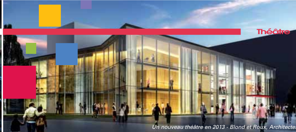
Un nouveau théâtre en 2013 - Blond et Roux, Architectes

Plein tarif : 6 € Étudiants, lycéens, demandeurs d'emploi et bénéficiaires du RSA : 5 € Enfants de moins de 14 ans : 3 € Tarif de groupe (à partir de 10 personnes, sur réservation) : 4,50 € Tarif pour les groupes scolaires et les centres de loisirs (sur réservation) : 2,50 € Pass Studio'phile (carte de 10 places non nominative, sans limite de validité) : 45 €