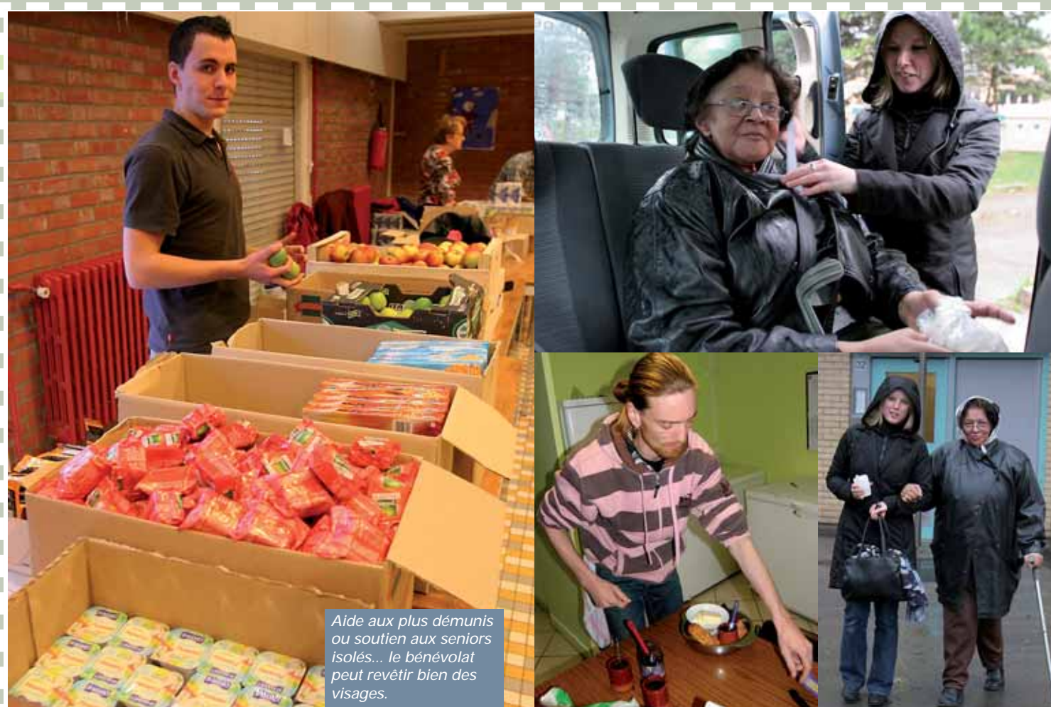
Aide aux plus démunis ou soutien aux seniors isolés... le bénévolat peut revêtir bien des visages.

En cette période de fêtes de fin d'année, nombre d'entre vous émettent le souhait de s'investir pour aider les autres. À Dunkerque, il existe pléthore d'associations et d'organismes qui recherchent des bénévoles. Voici quatre pages qui vous montreront tout ce que l'engagement peut vous apporter.