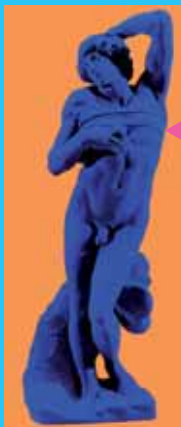
Yves Klein, L'Esclave de Michel-Ange

Musée portuaire - Jusqu'au 11 mars Pêcheurs d'Islande, une vie sans printemps