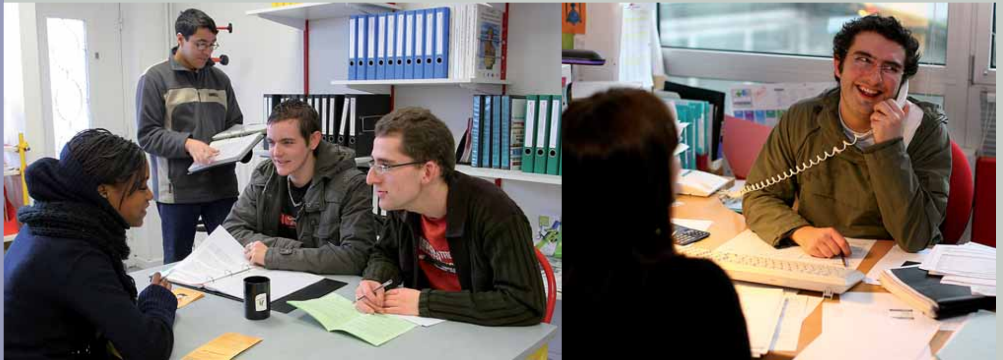
Au BIJ comme au service jeunesse, des référents vous donneront la marche à suivre pour mener votre projet vers le succès.

Vous avez une idée, un projet et de l'énergie à revendre pour le mettre en place ? Élaboration d'un projet précis et détaillé, création d'une association, constitution d'un budget prévisionnel, recherche de financement... Bouge2la vous aide à vous y retrouver dans les coulisses du montage de projet.