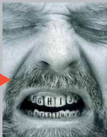
Étienne Pressager, L'Ogre alphabétique © Adagp, Paris 2008 Courtesy Galerie Aline Vidal

Jusqu'au 31 août Musée des Beaux-Arts ► D'après nature