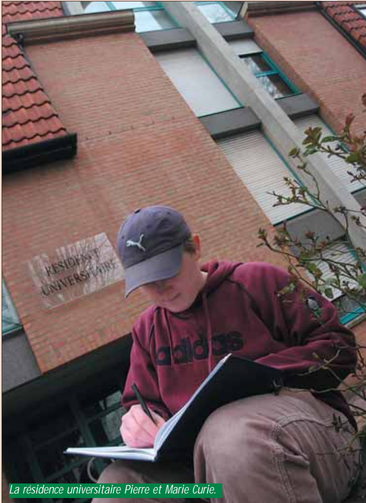
La résidence universitaire Pierre et Marie Curie.