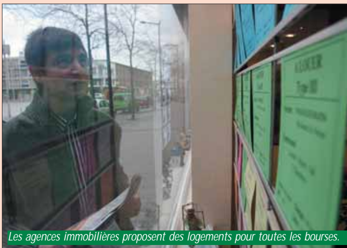
Les agences immobilières proposent des logements pour toutes les bourses.

tion une liste d'appartements et de studios, meublés ou non. Si vous êtes étudiant, des petites annonces de particuliers vous sont proposées en exclusivité au CROUS, sans frais d'agence et moyennant une faible cotisation. Le CROUS vous propose par ailleurs des logements en résidence