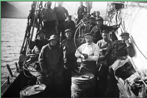
Les pêcheurs à bord de goélettes au Musée portuaire.