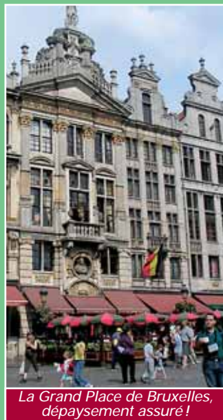
La Grand Place de Bruxelles, dépaysement assuré !

D unkerque n'est qu'à une dizaine de kilomètres de la Belgique. Rien de plus facile pour aller se balader de l'autre côté de la frontière... Sachez que la ligne « La Panne » du réseau DK'Bus Marine vous amène dans cette ville chaque jour de l'été (et la ligne 3B les week-ends et jours fériés) et la ligne 2B jusque Adinkerke. La gare