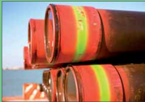
Dunkerque dans l'objectif d'Eggleston au LAAC.