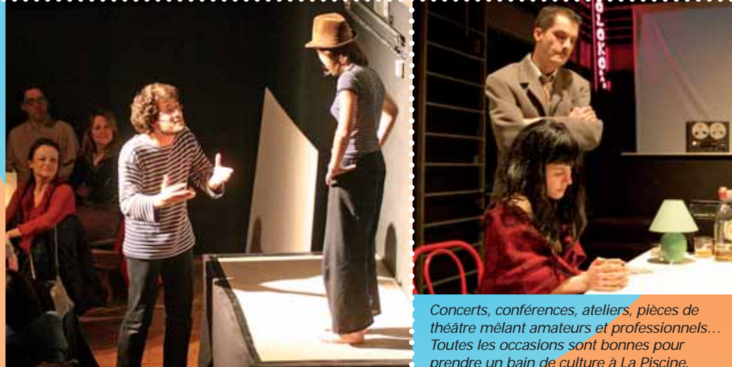
Concerts, conférences, ateliers, pièces de théâtre mêlant amateurs et professionnels... Toutes les occasions sont bonnes pour prendre un bain de culture à La Piscine.