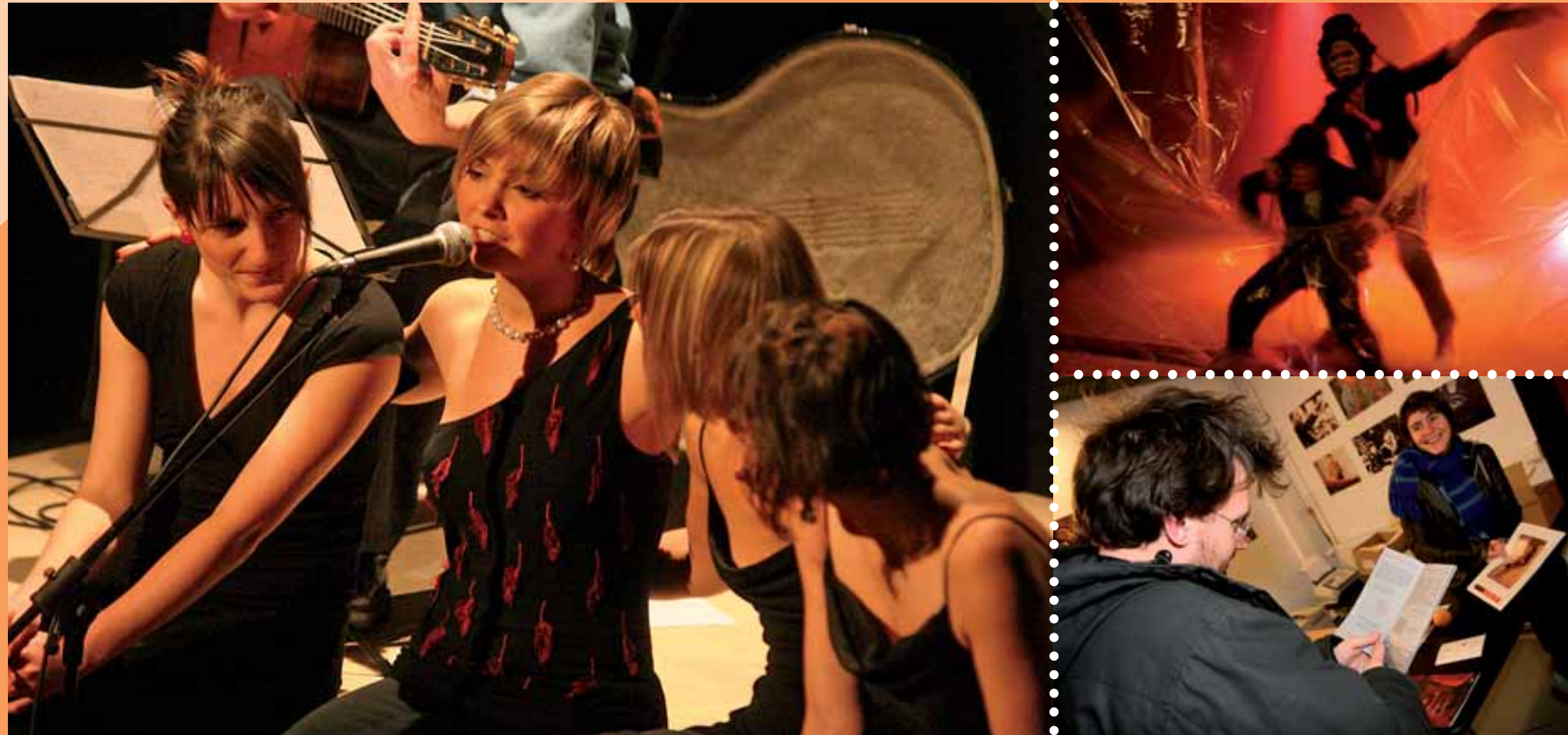
Ambiance russe mêlant chant et théâtre, en décembre dernier.