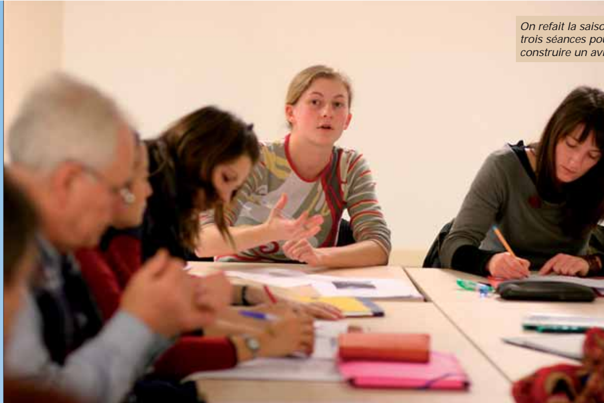
On refait la saison : trois séances pour se construire un avis critique.

Depuis octobre, le Bateau Feu, en partenariat avec l'Atelier Culture, a mis en place un atelier d'écriture critique inédit, au cours duquel passionnés et spectateurs occasionnels échangent autour du théâtre dans la bonne humeur. Bouge2là y était.