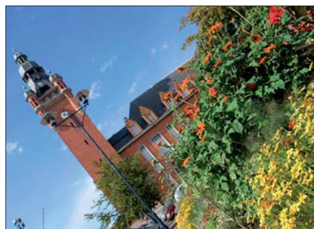
Pour édifier le beffroi de mairie de quartier de Rosendaël en 1933, les architectes se sont inspirés de l'ancien beffroi de Bergues (XVI e siècle).