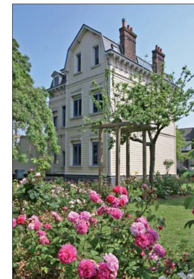
Située au cœur d'une jolie roseraie, la villa Myosotis est l'une des dernières maisons de bois de Dunkerque.

Entre grands édifices néo-flamands, belles villas de bois et hôtels particuliers, Rosendaël recèle mille et un trésors patrimoniaux que l'Office de tourisme vous propose de découvrir à travers l'une de ses trois balades gourmandes. Le rendez-vous est fixé au pied de l'hôtel de ville, facilement reconnaissable à son beffroi d'inspiration flamande. Un style