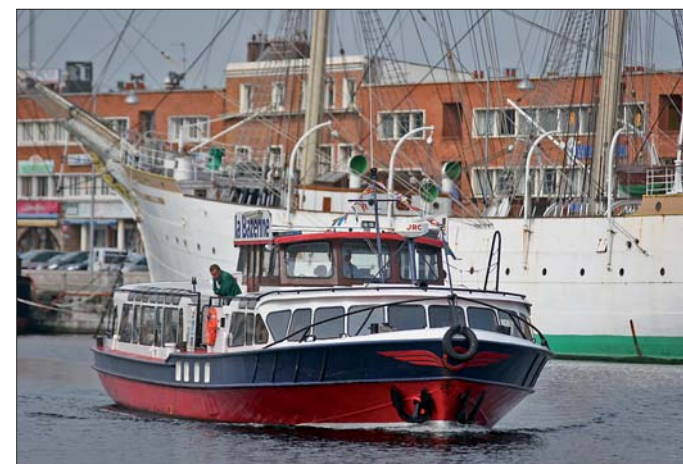
« La Bazenne » vous emmène jusqu'à l'église des Dunes.