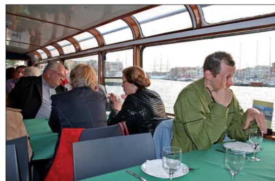
Durant l'été, des dîners-croisières sont proposés en nocturne (voir ci-dessous).