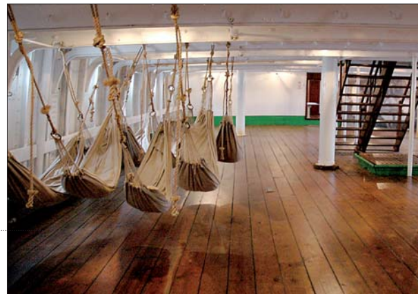
On accroche les hamacs pour la nuit dans l'entrepont du « Duchesse Anne ».

pagne et il est déjà l'heure d'embarquer pour une autre destination. Dix-sept années se sont écoulées entre la dernière campagne du « Grossherzogin Elisabeth » et le lancement le 16 février 1948 à Granville du bateau-feu BF6. Il le mission était de signaler les bancs de sable aux autres navigateurs, s'apparentent davantage à des marins de l'immobile. Emmenés sur zone par le baliseur, ils rejoignent le bateau-feu à bord d'une embarcation à moteur. Une fois la