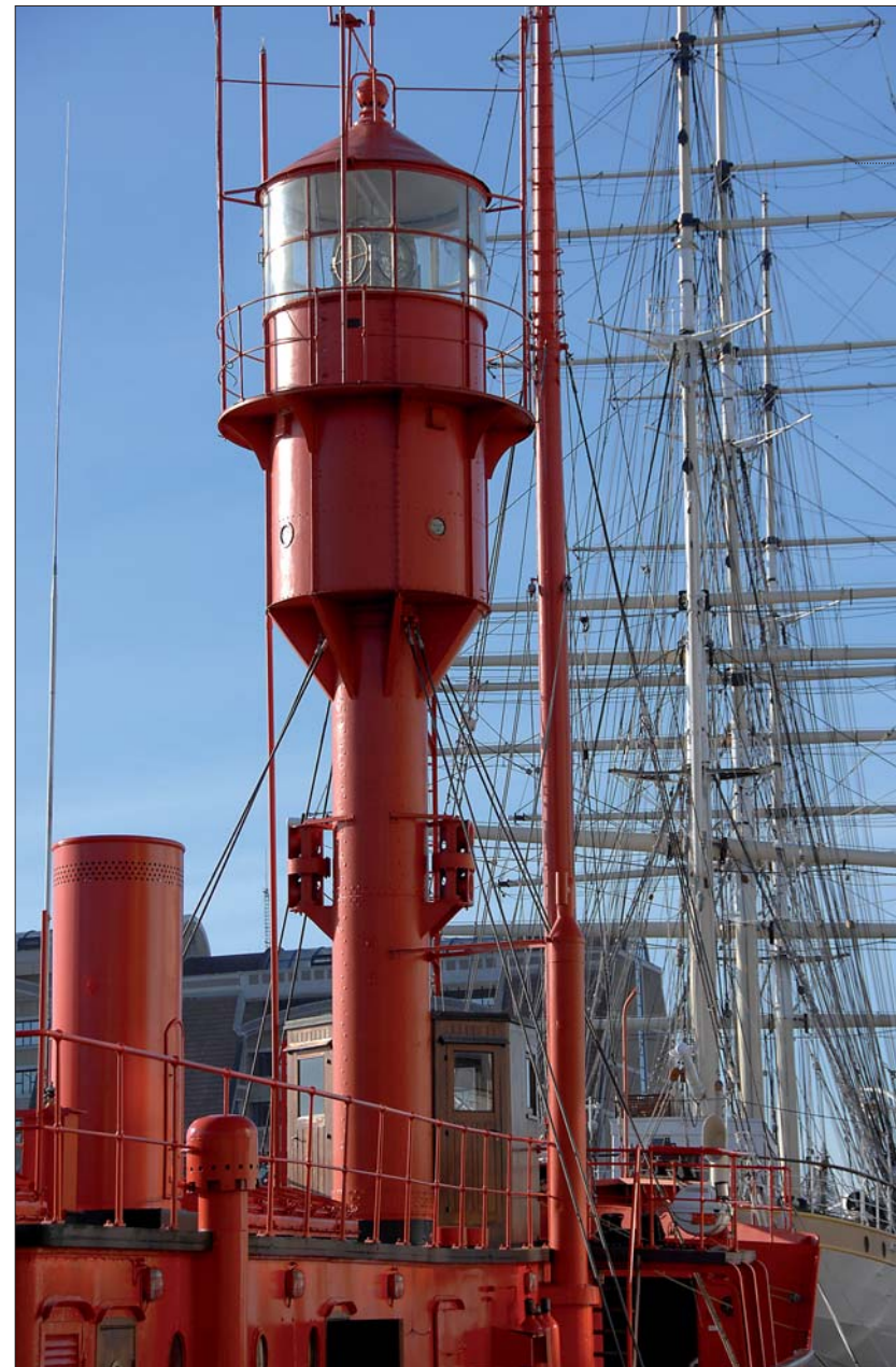
Le « Sandettie » pour découvrir la vie des « marins de l'immobile ».

météorologiques, les retouches de peinture et autres travaux d'entretien en salle des machines. Le reste du temps, on pêche, on joue aux cartes, on fait des maquettes ou des mots croisés... Les jours de gros temps, il faut avoir l'estomac bien accroché. À l'heure de la relève, on récuré, on cire, on se prépare à partir, avec un œil rivé sur les bulletins météo car il n'est pas question de quitter le navire si les creux sont trop importants. Le visiteur n'a pas ces soucis-là. Le prochain embarquement promet d'être de tout repos avec une belle exposition consacrée à la batellerie dans les cales de la péniche « Guilde » construite en 1929.