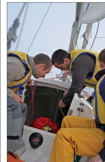
Avec les Dunes de Flandre, devenez équipier de pont à la journée ou à la demi-journée.