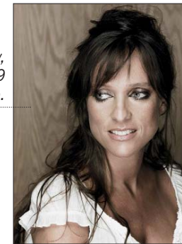
Lynda Lemay, jeudi 19 à Boulogne.

ly Jo Scott est une chanteuse envoûtante et vagabonde, qui manie le rock à la perfection. Sa voix hors du commun avait déjà enthousiasmé le public des 4Écluses en 2002... Le festival de la Côte d'Opale, c'est aussi des rencontres magiques comme celle du guitariste