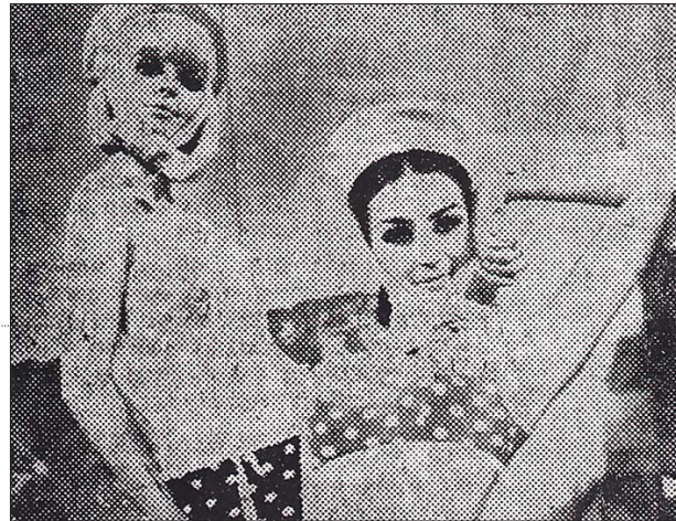
Sigmar Polke, Freundinnen I, 1967. KWM Krefeld

Dans le cadre de Dunkerque l'Européenne, le LAAC présente un panorama de la création allemande des années 1970 à nos jours, composé d'œuvres issues du Kaiser Wilhelm Museum de Krefeld, du SMAK de Gand et du Fonds régional d'art contemporain Nord-Pas de Calais. Ce tour d'horizon commence par les peintures et photographies de Gerhard Richter qui analysent le