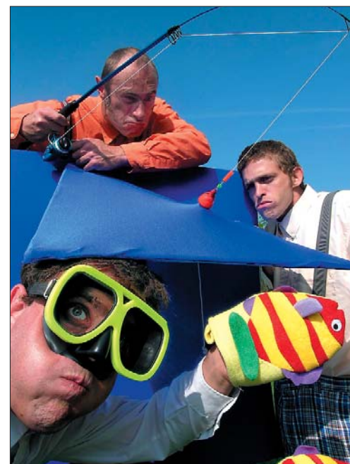
Aventures aquatiques rocambolesques avec la compagnie Bris de Banane sur la digue des Alliés.