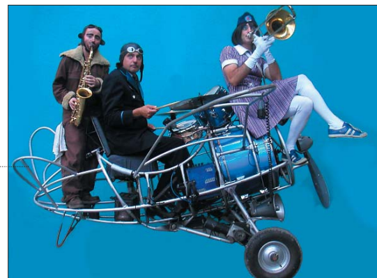
Ventilator entonnera des airs populaires place Turenne.

La treizième édition de « la Mouette Rieuse », festival de théâtre de plage, se déroulera les 11 et 12 août prochains à Malo-les-Bains et à Bray-Dunes. Fidèle à son objectif de soutien à la création artistique contemporaine, cette manifestation constitue un temps fort de la saison estivale. Durant ces deux jours, treize compagnies envahiront les rues et les places autour de la digue de Mer afin d'offrir