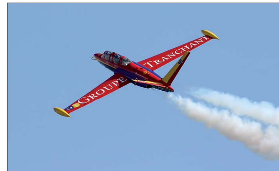
La patrouille de voltige Tranchant vous offrira leur tout nouveau numéro.

Fête aérienne L'aérodrome des Moères, basé à proximité de Ghyvelde (A16 sortie 36), accueillera les 25 et 26 août l'édition 2007 de la fête de l'air organisée par l'aéro-club de Dunkerque. Une trentaine de machines d'exception en provenance de toute l'Europe et un hélicoptère de la Marine nationale seront présents tout au long du week end. En plus des traditionnelles attractions et animations, des baptêmes de l'air sur avions de tourisme (type Piper PA 28) ou de voltige (Cap 10) seront organisés le samedi de 10 h à 19 h et le dimanche à partir de 10 h. Participeront notamment au show aérien du dimanche après-midi la patrouille Cartouches Dorées (équipe officielle de l'armée de l'air) et la vice-championne du monde de voltige aérienne, Pascale Alajouanine. De quoi ravir les passionnés comme les néophytes ! Entrée libre.