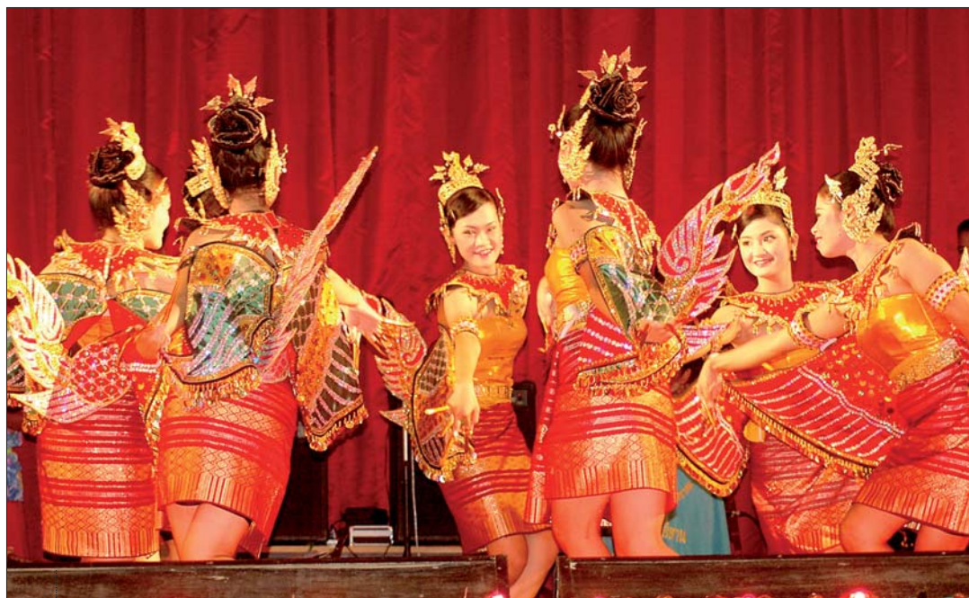
La Thaïlande sera à l'honneur le samedi 7 juillet.

Huit jours durant, 500 danseurs, chanteurs et musiciens partageront leur culture et mode de vie avec les habitants de l'agglomération à l'occasion du 18 e festival des folklores du monde. Basé à Bray-Dunes où un village artisanal animera la place Rubben, le festival fera plusieurs es-