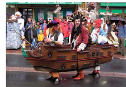
Les Échoués, un déambulatoire burlesque le samedi rue Belle Rade.

gnie Bris de Banane plongeront dans des aventures aquatiques rocambolesques. Suspense et émotions garantis. D'eau, il sera toujours question avec les Échoués, un déambulatoire burlesque mêlant chansons et histoire tragi-comique de pirates (18 h rue Belle Rade). Quant aux Happy Stars, des monocyclistes comiques et