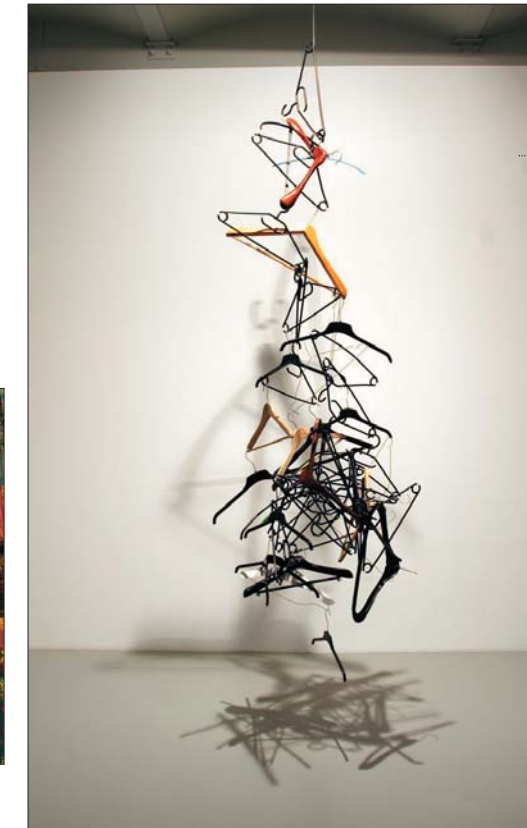
Markus Sixay, Superhelix, 2006. Frac Nord-Pas de Calais

ning dont les pièces traduisent le regard grinçant que leur auteur porte sur la société. Enfin, le cabinet d'arts graphiques confronte huit œuvres de Sigmar Polke datées de 1967 à 2002, caractéristiques de son engagement social mais aussi de ses interrogations sur l'art.