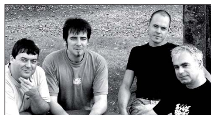
Bonne humeur avec Carré Manchot le 22.

Samedi 21, Dan Ar Braz sera l'ambassadeur vedette de cette édition 2007.