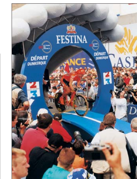
Dunkerque renoue avec le Tour de France après le prologue de l'édition 2001 disputé dans les rues de la ville.