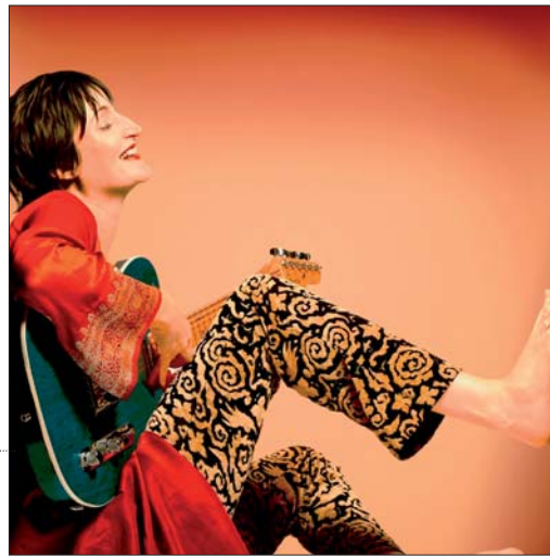
Beverly Jo Scott, première partie du concert d'Eddy Mitchell mercredi 11 au Kursaal.