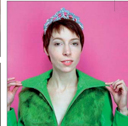
Zazie, samedi 21 à Calais.