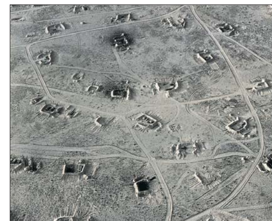
Sophie Ristelhueber, « Fait (N°43) », 1991, Coll. Frac Basse-Normandie © DR.

(Villeneuve d'Ascq), la Coupole (Saint-Omer), le Centre européen de la paix (Souchez), le Musée d'histoire et d'archéologie (Harnes), le fort Napoléon (Ostende), le Centre culturel d'Ypres, le Tablot House (Poperinge), le fort de Breendonk (Willebroeck), le château et le musée de Douvres, le Spitfire Museum.