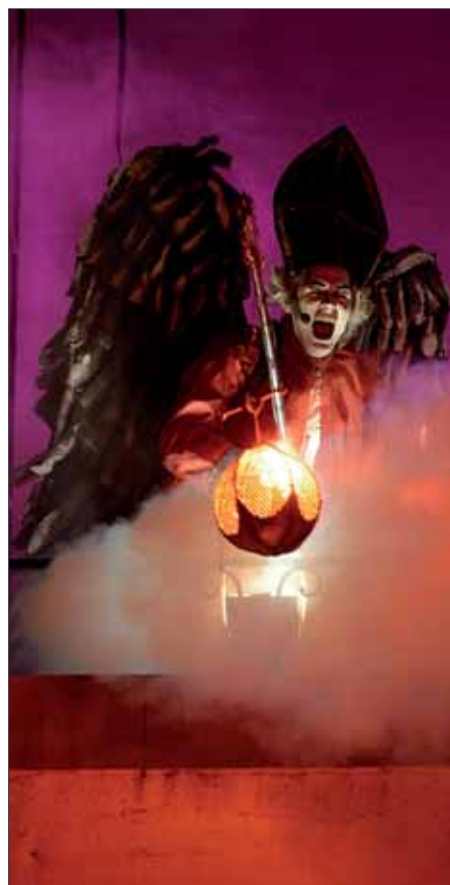
Flammes, explosions, effets spéciaux... Les comédiens de la compagnie allemande Theater Titanick plongent Dunkerque dans un univers surréaliste le samedi 29 septembre à partir de 21 h 30, place Charles Valentin.