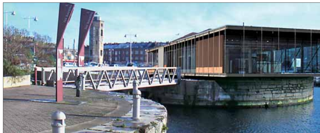
Le futur restaurant « Le Corsaire », dont la salle surplombera le bassin du Commerce.