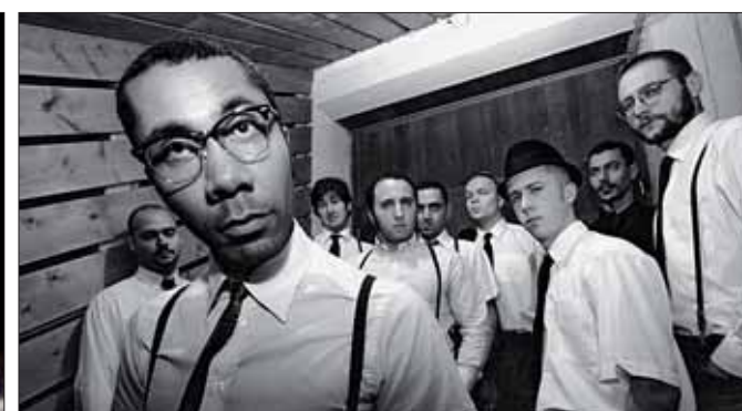
« Plis/Sons », un spectacle jeune public, le 17 novembre.