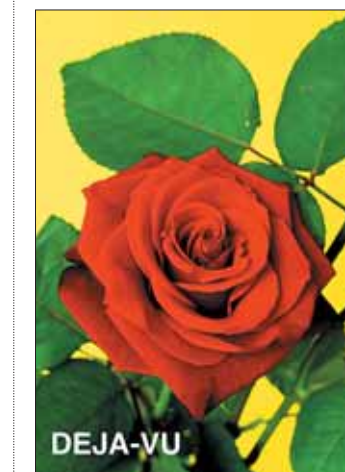
Visuel : Hans-Peter Feldmann

Permettre à tous les publics de découvrir et d'appréhender l'art contemporain, telle est l'ambition du Fonds régional d'art contemporain Nord-Pas de Calais qui organise à partir du 16 novembre un vaste projet dans toute la région. Baptisée « DÉJÀ-VU », cette manifestation se propose de mettre en lumière dans une cinquantaine de lieux très divers et inhabituels (hôpitaux, établissements scolaires, entreprises, médiathèques...) des œuvres d'art issues de la collection du FRAC revues et sélectionnées par l'artiste allemand Hans-Peter Feldmann. Objectif: confronter l'art contemporain avec la vie et le quotidien. À Dunkerque, vous pourrez ainsi apprécier les œuvres d'Achille Castiglioni, Hrafnkell Sigurdsson, Roman Singer, Bertrand Lavier, la série Glassfab,