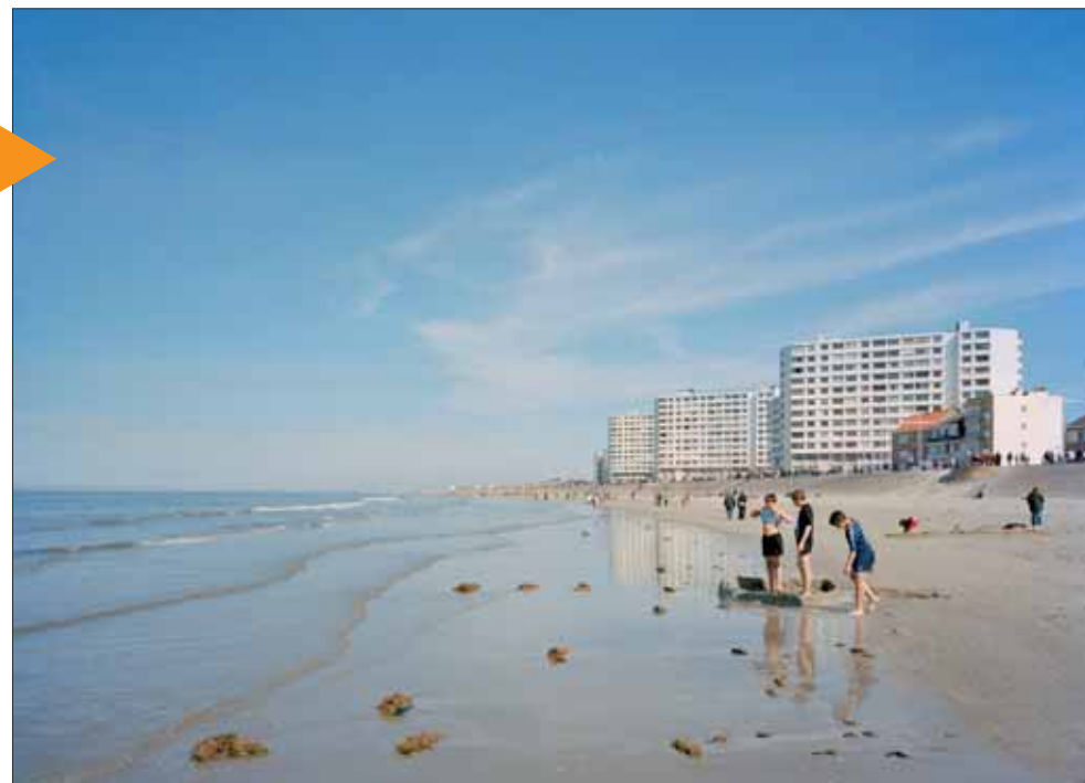
Jürgen Nefzger, Dunkerque, 2007 © Courtesy Galerie Française Paviot.

Depuis le début des années 1990, le photographe allemand Jürgen Nefzger porte un regard acéré sur les mutations du paysage. Dans le cadre de Dunkerque l'Européenne, il a été invité à explorer le territoire dunkerquois. Le musée des Beaux-Arts et le LAAC présentent le rendu de son travail dans un parcours de plus de trente tirages de grand et moyen formats et une installation sonore et photographique. Tarif : 4,50 €, 3 €, 1,50 €. Tél. 03 28 59 21 65 et 03 28 29 56 00.