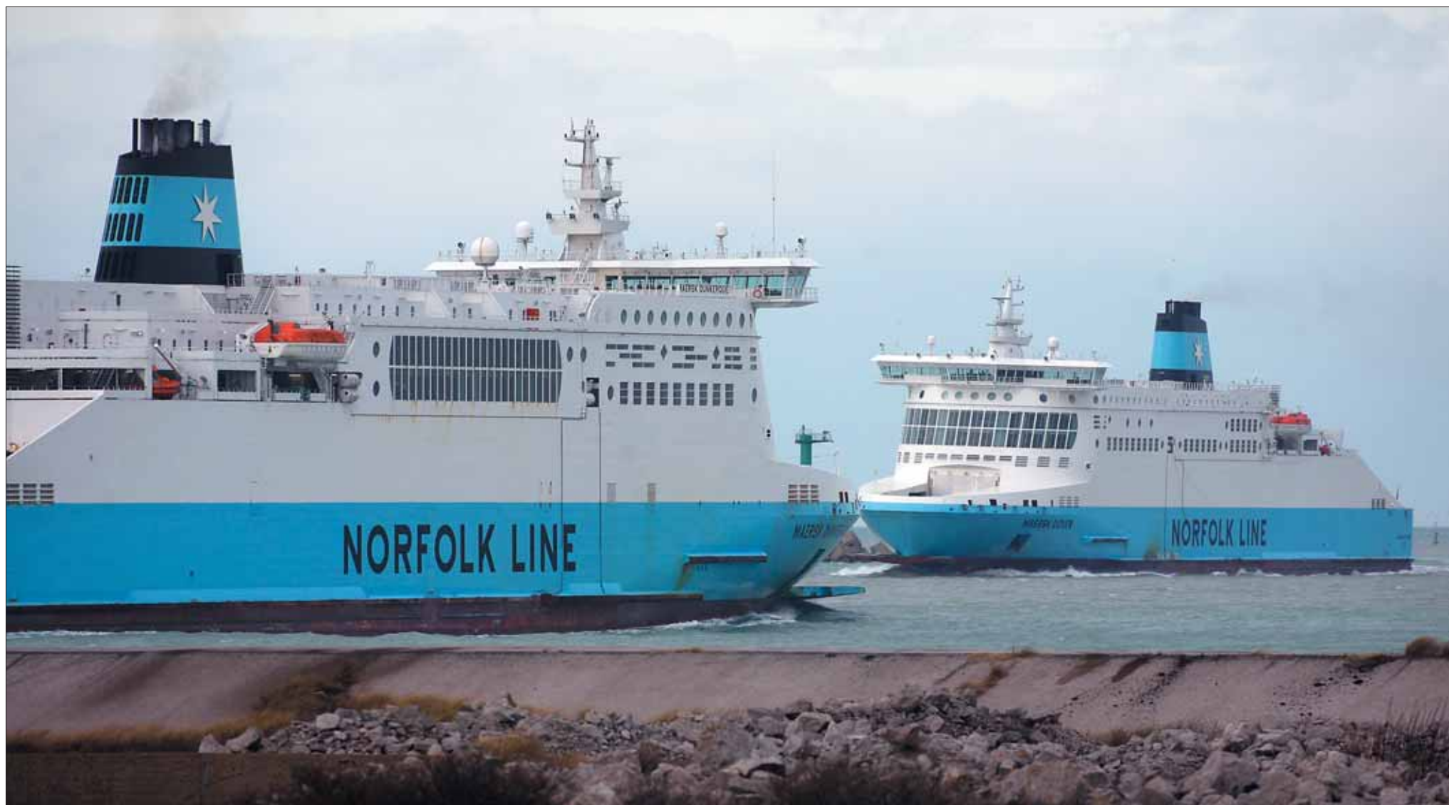
Le trafic roulier vers la Grande-Bretagne est en constante progression.

Cette volonté d'aller de l'avant passe d'abord par une politique d'investissements offensive avec une enveloppe de 54,7 millions d'euros programmée en 2008. La première phase d'aménagement de la desserte ferroviaire dite du « Barreau de Saint-Georges » sera achevée cet été au port ouest. Elle se poursuivra ces prochaines années avec l'électrification de la voie puis son doublement. Des travaux importants de rénovation et d'extension seront également opérés au terminal à conteneurs, tandis que le quai de l'Escaut sera adapté pour offrir un meilleur service à la fois aux navires et aux barges. Des travaux similaires seront réalisés au quai