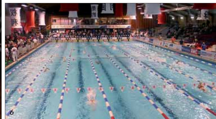
4. Les premières maisons du Grand Large sortent de terre. 5. Le port, poumon de notre agglomération. 6. La piscine sera totalement reconfigurée d'ici 2012.

ment une plus grande capacité d'initiative. Nous allons également mettre en place de nouvelles actions de proximité en créant un véritable quartier sur la zone des Glacis qui est une spécificité à Dunkerque. Le quartier des Glacis disposera de son propre conseil communal et pourra se développer avec ses habitants. Je rappellerai aussi que nos conseils communaux sont des points d'ancrage et de liaison avec les quartiers des villes voisines. Il faut travailler à l'aménagement de ces territoires situés aux extrémités de Dunkerque, en bonne coordination avec Leffrinckoucke d'une part et Fort-Mardyck, Coudekerque-Branche, Grande-Synthe et Saint-Pol-sur-Mer d'autre part. Nous sommes d'ailleurs déjà en train de réfléchir avec Petite-Synthe et Saint-Pol-sur-Mer à la construction d'une nouvelle piscine sur le secteur ouest de la ville.