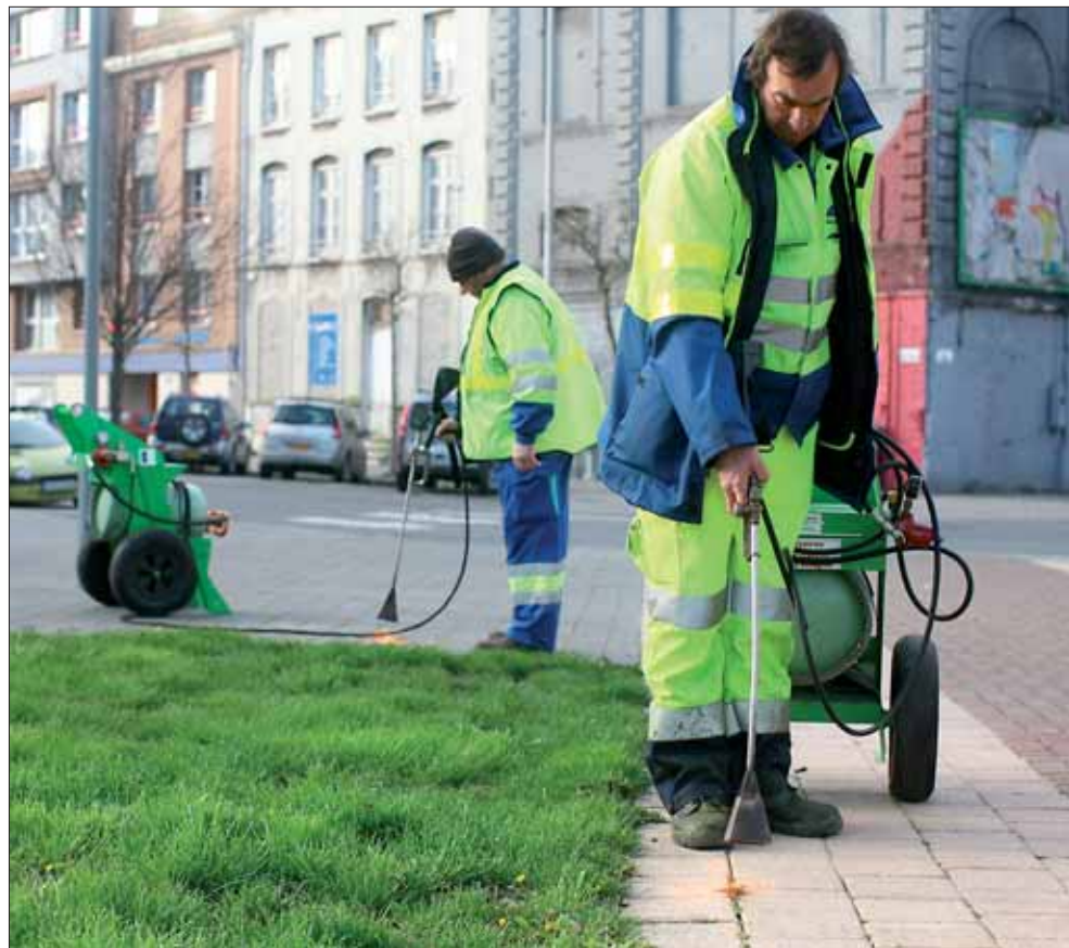
Désherbage à la flamme sur les trottoirs de la Basse Ville.