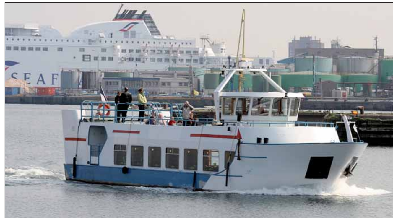
Le « Texel » vous emmène visiter le port chaque week-end.

Les plus jeunes précisément se voient offrir une approche douce du sport à travers la baby-gym, mais également des stages d'arts plastiques autour des expositions du LAAC. Les adolescents auront eux aussi l'embarras du