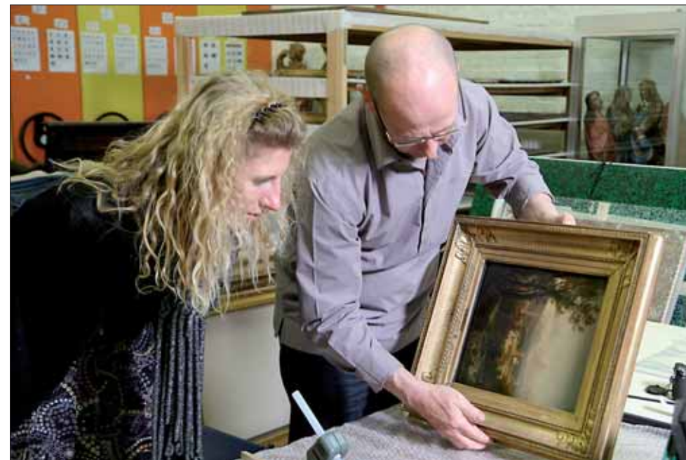
Le déplacement des œuvres est réalisé avec précaution au musée des Beaux-Arts.

Si les beaux jours sont propices aux voyages pour les êtres humains, les œuvres des musées dunkerquois font fi des considérations météorologiques pour parcourir le monde en qualité d'ambassadrices de notre ville. Ainsi, le 16 avril dernier, une toile du musée des Beaux-Arts - « La place du Peuple vue du Pincio à Rome » de l'artiste français Nicolas-Antoine Taunay - quittait Dunkerque dans un caisson climatique pour rejoindre le Brésil où elle sera successivement exposée au musée national des Beaux-Arts de Rio de Janeiro (du 6 mai au 6 juillet) puis à la Pinacothèque de São Paulo (du 17 juillet au 7 septembre). Cette huile sur bois de la fin du XVIII e siècle intègre un vaste programme de manifestations consacrées aux deux cents ans de l'arrivée de la famille royale portugaise au Brésil. Une autre œuvre du musée - « Nature morte » de Peter Claesz - a été exposée quant à elle du 19 février au 4 juin au musée d'Art de Jérusalem avant de rejoindre le musée d'Art et d'Histoire du judaïsme à Paris pour une présentation estivale. Le LAAC ne demeure pas en reste avec le prêt d'une œuvre de Karel Appel au Cobra Museum d'Amstelveen (Pays-Bas) dans le cadre d'une rétrospective consacrée au maître néerlandais. Avant ces destinations internationales et pour ne citer que quelques exemples récents, il y a eu des toiles de Serge Poliakoff, Eugène Dodeigne et Alfred Manessier, qui ont pris la direction, l'automne dernier, du musée belge de Saint-