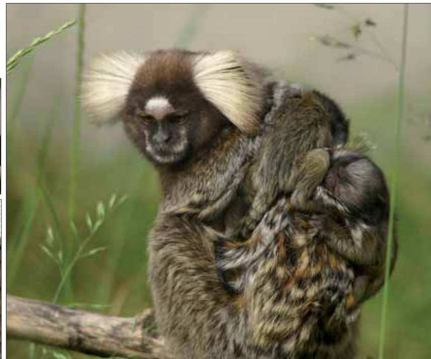
Sur le pelage de maman oustiti, deux petits sont agrippés.