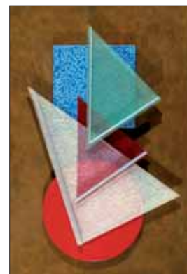
César Domela, Relief 147, 1973 © J. Quecq d'Henriprêt, LAAC, donation (ADAGP).

Musée des Beaux-Arts, place du Général de Gaulle. Tél. 03 28 59 21 65. Ouvert tous les jours sauf le mardi de 10 h à 12 h 15 et de 14 h à 18 h. Visites guidées les dimanches 6 et 20 juillet, 3 et 17 août.