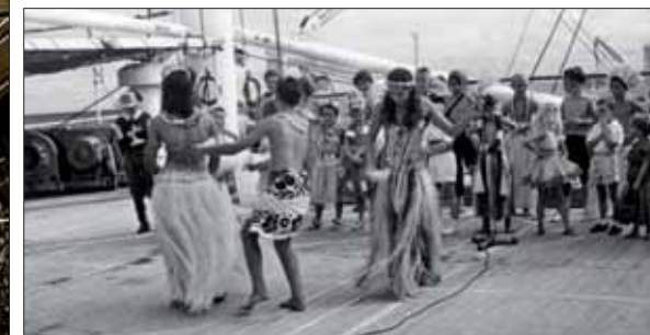
L'équipage a préparé une petite fête pour les enfants à bord du « Calédonien ».

techniques de construction, les aménagements intérieurs, les choix artistiques, le traitement des décors, mais aussi sur les relations parfois complexes qu'entretenaient les commanditaires, les concepteurs, les ouvriers et les intervenants extérieurs tels que les décorateurs, céramistes et autres peintres et sculpteurs. Imaginés et conçus pour le confort et le seul bien-être des plus fortunés, ces vaisseaux au long cours furent le théâtre d'une vie sociale intense et luxueuse pour les uns, beaucoup plus