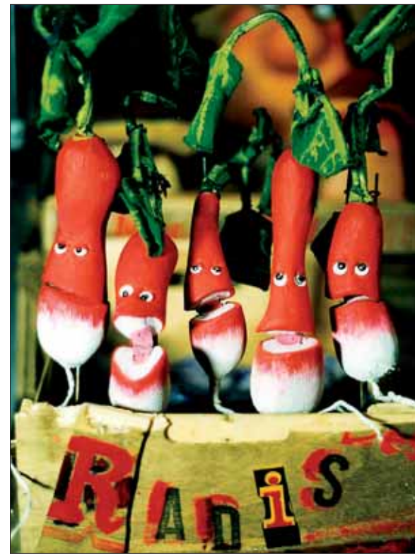
Numéro de dressage de légumes par la compagnie les Zanimos.