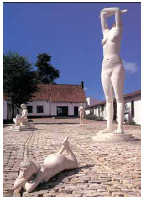
Les Naiades du musée George Grard.