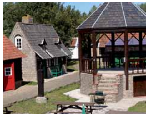
Un musée de plein air pour un village reconstitué.