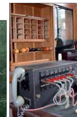
L'ancienne gare de Blendecques a été transformée en musée des chemins de fer.

Située au cœur de l'Audomarois, la vallée de l'Aa est une région relativement méconnue qui recèle pourtant de nombreux trésors : une faune et une flore préservées, des paysages verdoyants et de pittoresques villages... Pour découvrir toutes ces richesses de façon originale, l'Association du chemin de fer touristique de la vallée de l'Aa propose une petite promenade champêtre de deux heures à bord d'un authentique autorail diesel de 1953. Surnommée le « Picasso » en raison de ses couleurs vives et de la position surélevée et dissymétrique de son poste de pilotage, cette vieille machine rouge et crème parcourt tous les