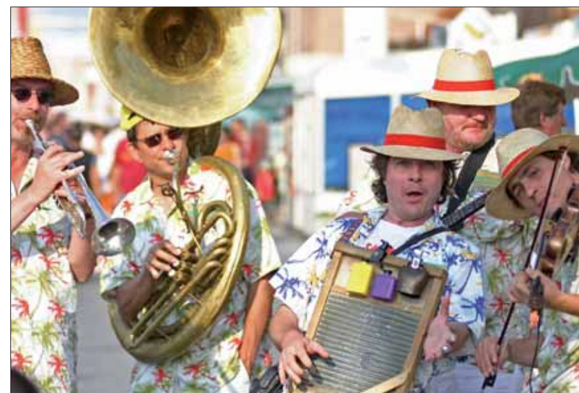
Du jazz sur les plages de Malo et de Bray-Dunes.