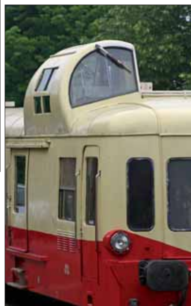
Des couleurs vives et une position surélevée et dissymétrique du poste de pilotage ont valu à cet autorail le surnom de « Picasso ».