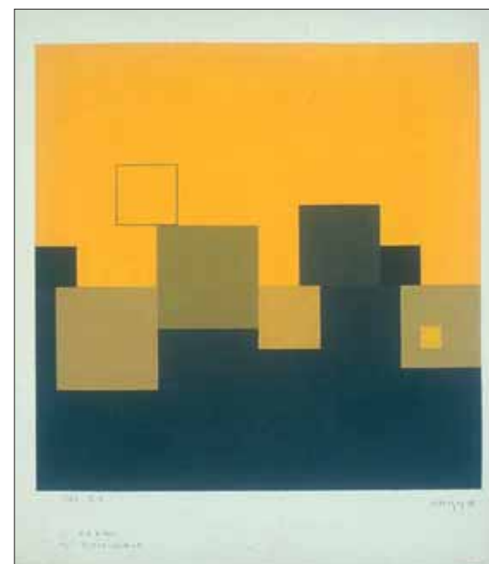
Guy de Lussigny, Sans titre, 1978 © J. Quecq d'Henriprêt, LAAC, don André Le Bozec.

et tactile. L'exposition est complétée par une sélection de reliefs du XX e siècle, parmi lesquels des compressions de César et des accumulations d'Arman. La seconde exposition, « Carte blanche à André Le Bozec », a elle aussi été initiée par une donation,