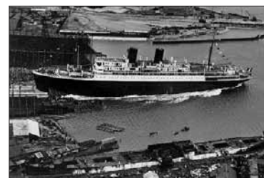
Mise à l'eau du paquebot « Colombie » en 1931. Collection Musée portuaire. Don de l'Association des anciens des ACF.

Des visites guidées du trois-mâts « Duchesse Anne », du bateau-feu « Sandettie » et de la péniche « Guilde » sont organisées quotidiennement à 15 h 30 du 1 er au 5 juillet. À compter du 6 juillet, les horaires sont quelque peu modifiés : le Musée portuaire vous proposera dès lors des visites guidées du « Duchesse Anne » tous les jours de la semaine à 14 h 30, 15 h 30 et 16 h 30, tandis que le « Sandettie » (audio guide) et la « Guilde » sont à découvrir en visite libre de 14 h 30 à 18 h. Musées à quai et à flot : 9€ (tarif plein), 7,50€ (tarif réduit), 22€ (forfait famille). Musée à flot seul : 7,50€ (tarif plein), 6€ (tarif réduit), 18€ (forfait famille).