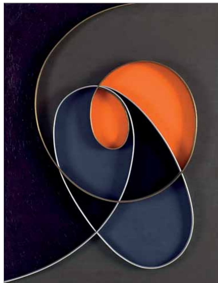
César Domela, Relief 105, 1966 © B. Huet/Tutti, LAAC, donation (ADAGP).

Le Lieu d'art et action contemporaine (LAAC) propose deux expositions autour de la forme et de la géométrie dans l'art moderne.