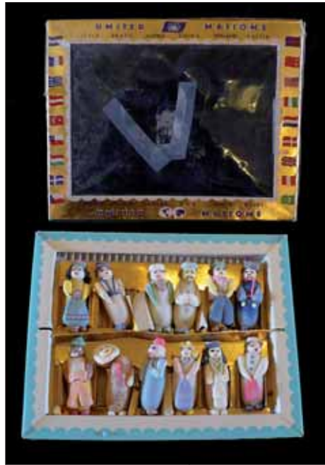
Poupées de sucre, collection de l'ONU, 2005- 2008