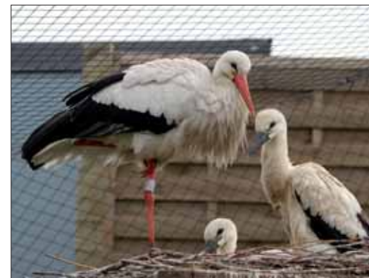
Sept cigogneaux ont vu le jour au printemps.

procher au plus près grands ducs, flamants roses, hérons ou tadornes de Belon... Dans des biotopes reconstitués, l'observation de ces oiseaux est idéale. En revanche, il vous faudra un peu de chance et de patience pour apercevoir les pensionnaires suivants : animal nocturne, le castor d'Europe niche dans sa hutte à l'abri de la lumière du jour... Juste en face, les loutres