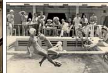
Jeux aquatiques autour de la piscine du « Cambodge ».