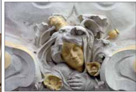
Un des nombreux détails sculptés de la villa Ringot.