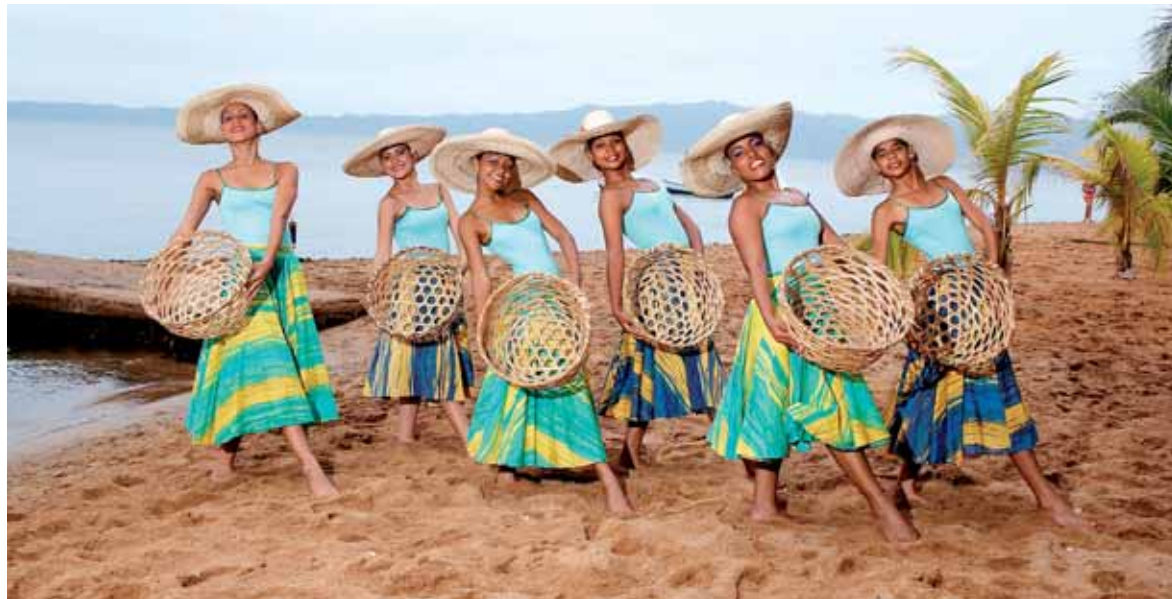
L'ensemble vénézuélien « Fundacion Danzas Nac. Mari-Quitar », samedi 12 juillet à 14 h 30, place du Centenaire à Malo.

Festival des folklores du monde - du 11 au 18 juillet