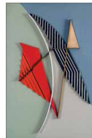
César Domela, Relief 284, 1984