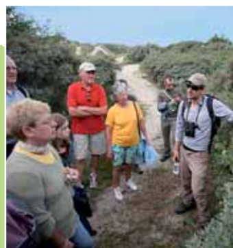
les 18 et 23 août, départ à 14 h 30 de l'Office de tourisme de Leffrinckoucke-Plage.

Tarif : 6,50€ (adultes), 4,50€ (enfants de 4 à 14 ans). Transport gratuit des vélos. Tél. 03 21 93 45 46 ou 03 21 12 19 19.