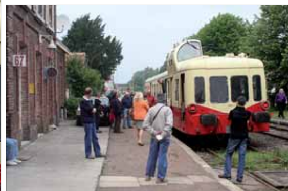
Sur le quai comme dans la voiture, l'atmosphère est à la fête.