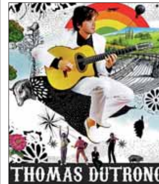
Thomas Dutronc, mardi 15 à 20h45 à Boulogne-sur-Mer.

Tarif du concert de Camille: 25€ et 22€ (demandeurs d'emploi, étudiants, moins de 18 ans). Location au Beffroi. Carte passion pour tous les spectacles (150€) et carte émotion pour quatre spectacles (75€). Renseignements au 03 21 30 40 33. Programme complet à l'Office de tourisme au Beffroi ou sur le site www.festopale.cx .