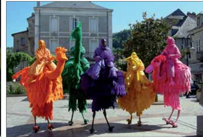
Les oiseaux géants de la compagnie Neighbourhood Watch.

de ses actes sur les générations futures. Sur une voie ferrée circulaire, des personnages se métamorphosent, pris dans le cycle infernal de la vie. « TrainTamarre » est un « réveil de la vie », « un stimulant à réagir », un appel à la mobilisation qui se veut poétique et féérique... 50 minutes - Fixe.