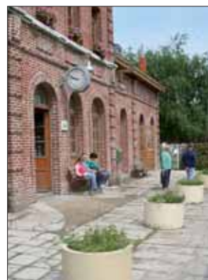
Les passagers attendent patiemment l'arrivée du vieil autorail en gare de Lumbres.