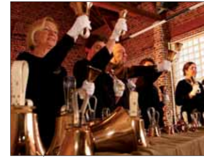
L'ensemble des Handbells, le 10 juillet.