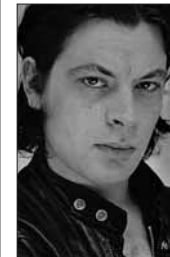
Benjamin Biolay, samedi 12 à 20h45 à Calais.