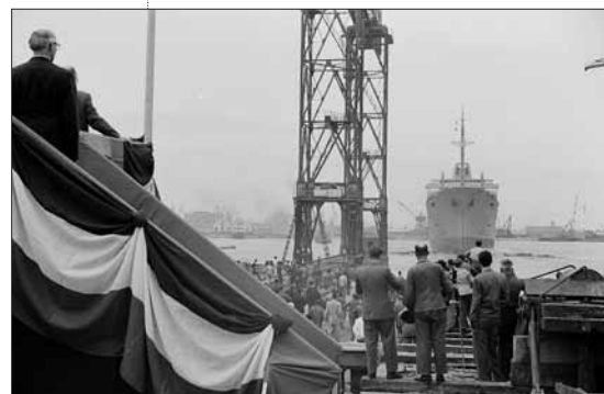
Lancement du « Cambodge » en 1952.

Musée portuaire - jusqu'au 5 janvier 2009