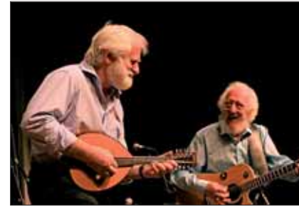
▲ The Dubliners, Kadril et Alumea, ► guest stars de cette édition 2008.