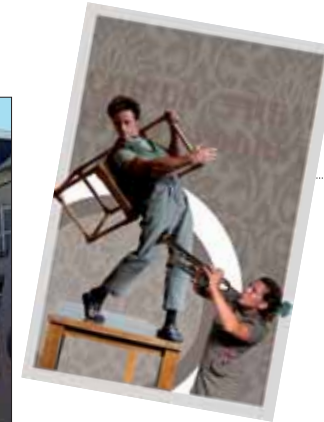
Entrez dans la poésie musicale D'irque & Fien.

« Borgnefesse, flibustier des cœurs » par Les Dits d'Ascalie Borgnefesse, Bout-Dehors, Fine Mouche, Singe et Grenouille ont rendez-vous sur une île mystérieuse... Au moment d'appivoiser les indigènes, ils découvrent une passagère clandestine, Ann Bonny, la piratesse... 75 minutes - Fixe.