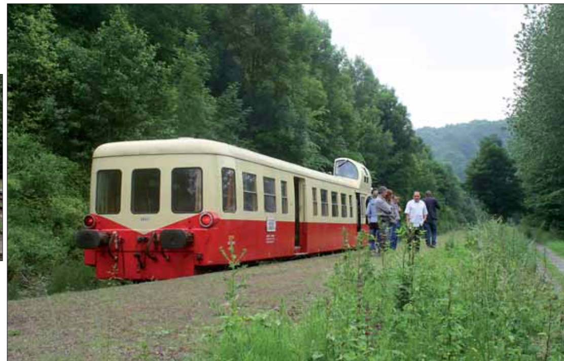
Longue de 15 km, la ligne Arques-Lumbres serpente au milieu des sublimes paysages de l'audomarois.