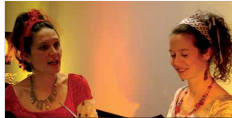
« Les Perles irrégulières », deux voix de femmes émouvantes pour une soirée baroque.