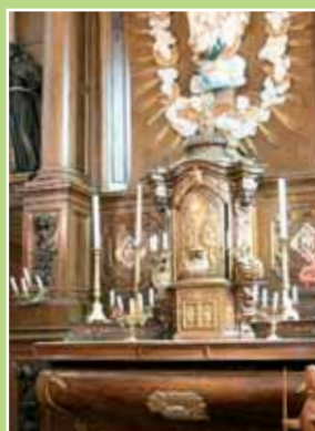
Le retable de Quaëdypre

Petite-Synthe Mardi de 8 h à 13 h, place Saint-Nicolas, et jeudi de 8 h à 13 h, place Louis XIV. Rosendaël Dimanche de 8 h à 13 h, place des Martyrs de la Résistance.