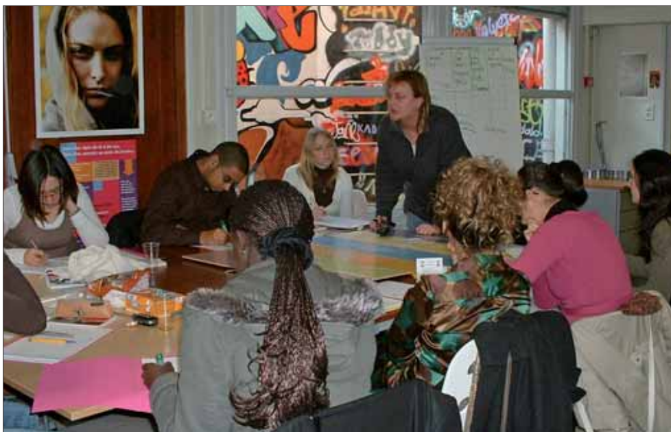
Un endroit « neutre » pour mieux communiquer.