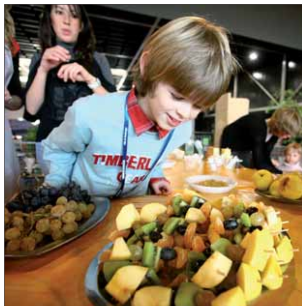
Les parents-relais de Petite-Synthe ont notamment travaillé sur les bienfaits des fruits.