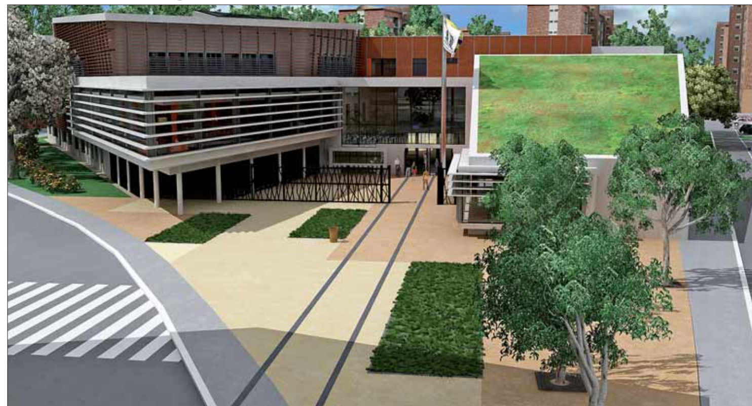
Le nouveau collège devrait ouvrir ses portes pour la rentrée de septembre 2010.

En janvier 2005, le Conseil général, dans le cadre du programme de constructions et de reconstructions des collèges liées à la politique de la ville, décidait de mener une réflexion, en partenariat avec l'Inspection académique et la ville de Dunkerque, sur une nouvelle sectorisation des collèges de Dunkerque-Centre. Un an plus tard, la décision était prise de reconstruire le collège Van Hecke, fusion des collèges Boileau et Samain.