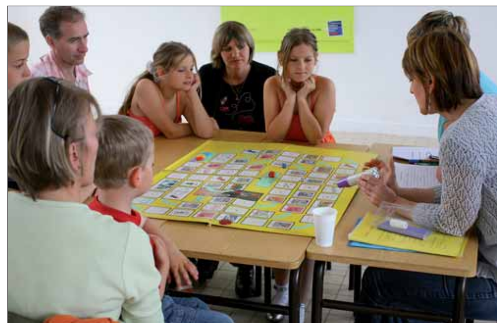
L'école de l'asthme accueille parents et enfants pour leur apprendre à prévenir et gérer les crises.

lorsqu'on sait que cette maladie touche 10 % des moins de 18 ans et que les trois quarts des arrivées aux urgences pour crise d'asthme auraient pu être évitées si le patient connaissait bien sa maladie et la gestion d'une crise. « Nous proposons déjà un programme d'informations au CHD », rappelle le docteur Delepoulle, « mais uniquement pour les enfants hospitalisés ou qui venaient en consultation. Malgré une sensibilisation opérée auprès des médecins de ville, nous avons peu de patients venant de l'extérieur car l'hôpital fait toujours un peu peur. Le seul moyen de progresser était de s'ouvrir à la ville. Nous avons d'emblée été soutenus dans notre démarche par la Ville, l'Union des mutuelles de Dun-