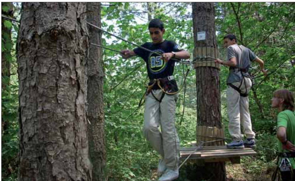
Sport et nature figurent au programme de la semaine de cohésion.