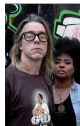
Le duo Bellrays mixera soul et rock'n'roll le jeudi 20 novembre.

Les 4Écluses vous donnent l'opportunité de mettre votre grain de sel dans sa programmation. Écouter des disques, donner votre avis et proposer vos groupes « coup de cœur » piochés sur Internet ou découverts dans des festivals feront partie de vos missions. Une soirée spéciale sera programmée début 2009 pour que les artistes retenus se produisent sur scène. Les prochaines réunions du comité auront lieu les 18 novembre et les 2 et 16 décembre de 18h30 à 20h. Pour y participer, contactez Bérengère sur www.communication@-les4ecluses.com .