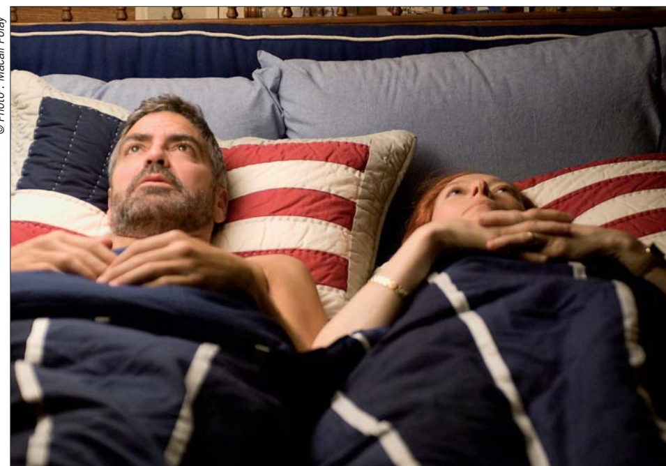
« Burning after reading » de Joel et Ethan Coen.