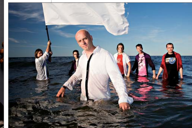
Le «Max Klezmer Band», une formation pleine de ressources aux 4Écluses le jeudi 29 janvier.

Le Bateau Feu consacre un temps fort à la Pologne du 21 janvier au 3 février, en collaboration avec les 4Écluses, l'Atelier Culture de l'Université et le Studio 43. L'occasion d'appréhender les nouvelles formes de création artistique dans ce pays à la fois familier et méconnu.