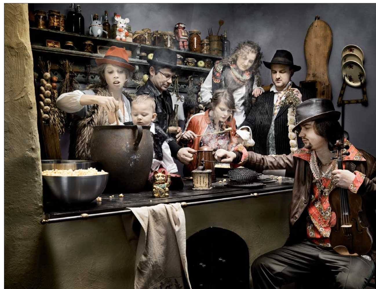
Le «Warsaw Village Band» clôturera le temps fort en fanfare le mardi 3 février.