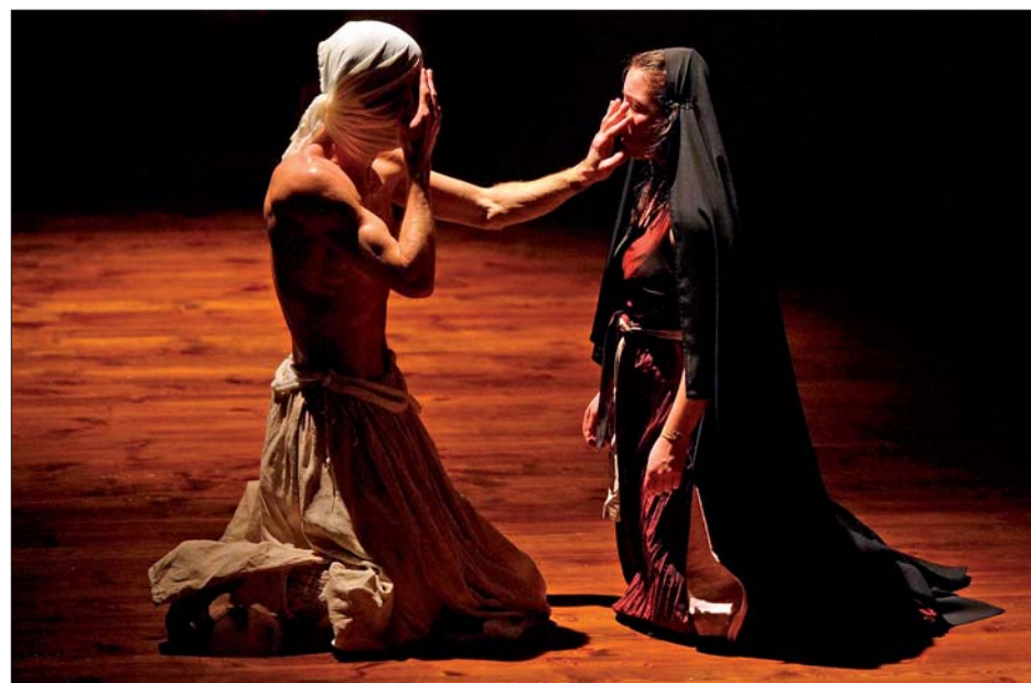
«Lacrimosa», une pièce représentative du nouveau théâtre polonais, les 30 et 31 janvier.