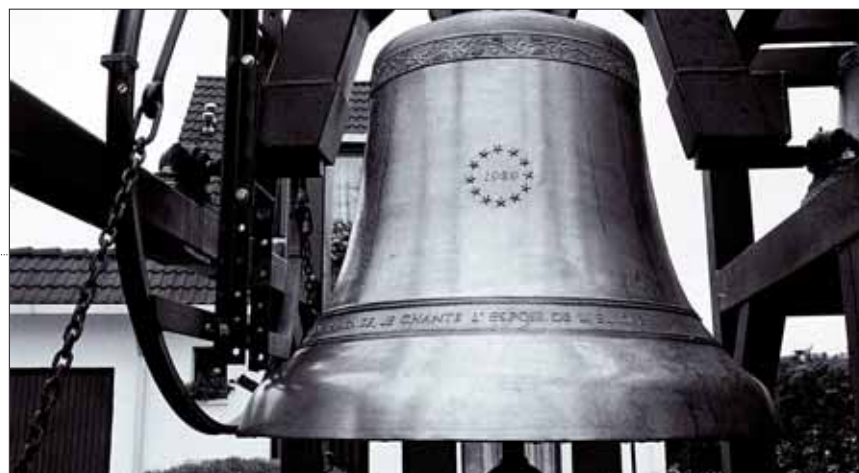
Le carillon de Dunkerque lors de son inauguration en 1962.

rendre l'instrument accessible à la visite. Les Dunkerquois devraient donc entendre à nouveau chanter le carillon de l'église Saint-Éloi d'ici le mois de juillet. Engagée dans une démarche de restauration de son patrimoine musical, la Ville a pu démarrer ce chantier d'un montant de 482 700 euros HT grâce au Conseil général et au partenariat signé avec le groupe Total. La société, par le biais de la Fondation du patrimoine, a en effet apporté un soutien financier à hauteur de 255 000 euros. Rappelons par ailleurs que l'appel à souscription lancé par la Ville en janvier 2008 est valable jusqu'à la fin du mois de mars. Si vous souhaitez contribuer à la restauration du carillon de Saint-Éloi, rendez-vous sur le site www.ville-dunkerque.fr . ◆