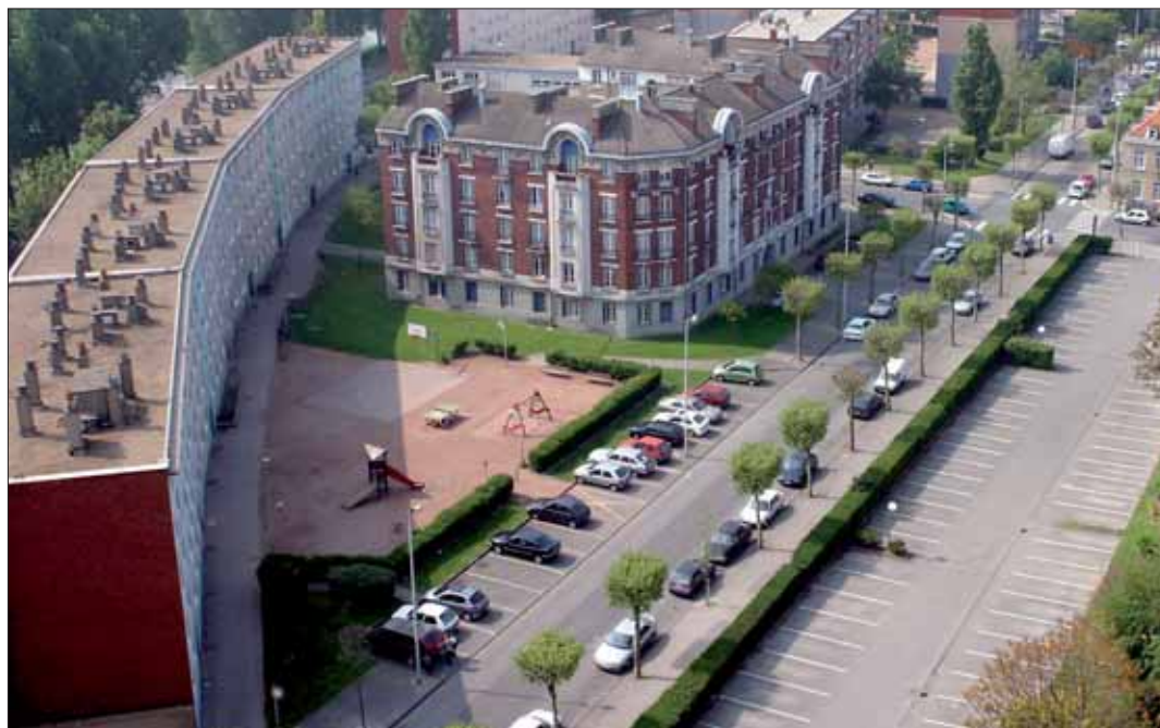
Le Bâtiment 5 (à gauche) laissera place à cinq petits ensembles de logements, tandis que le HBM Charles Valentin (au centre) sera entièrement restructuré tout en conservant ses façades historiques.

Présidée par Michel Delebarre, la réunion du conseil municipal du 9 mars a été riche en délibérations synonymes d'investissements importants, en particulier dans les domaines de l'habitat mais aussi de la culture, de l'éducation et du sport. Ainsi, en Basse Ville, suite à l'intervention de Wulfran Despicht, adjoint au maire, les élus ont acté la démolition de l'immeuble Bâtiment 5 (80 appartements) qui s'étire le long du canal exutoire. Il sera remplacé par cinq petits plots qui permettront à la fois d'offrir des logements de qualité à loyer maîtrisé tout en contribuant à ouvrir le quartier sur la ville. Le même principe de démolition-reconstruction sera appliqué à quelques dizaines de mètres de là au HBM Charles Valentin, doyenne des HLM dunkerquoises. Il est à noter que ce ne sera pas une démolition intégrale puisque les trois façades de cet immeuble caractéristiques des années 1930 seront conservées. Les 50 logements existants laisseront place à 40 appartements plus grands et plus confortables. Deux immeubles d'habitation de la rue du Repos à Petite-Synthe sont également concernés par cette procédure. L'un des deux est quasiment vide d'occupants, une partie d'entre eux ayant rejoint un lotissement de maisons aménagées dans le secteur Dessinguez. Ici également, on