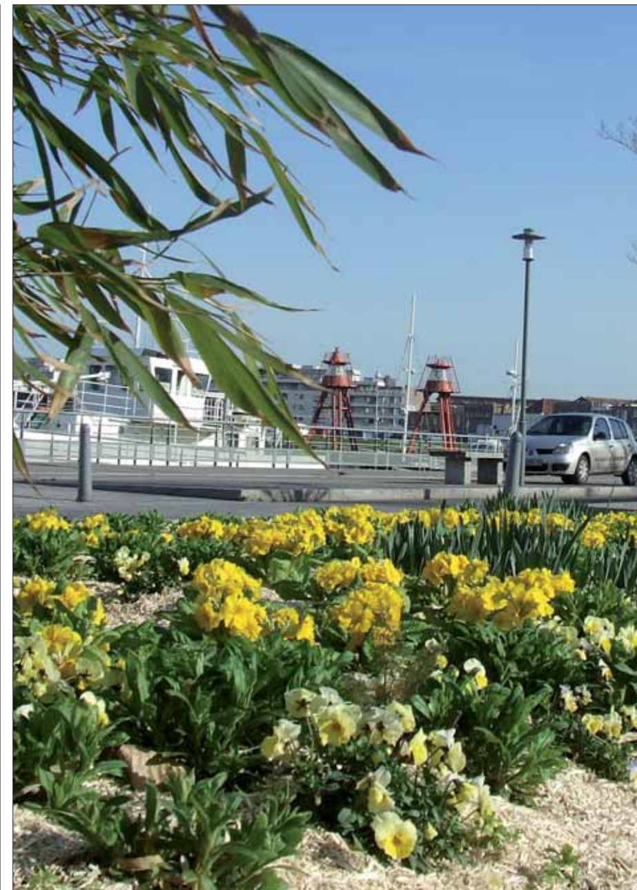
Le paillage : un bon moyen pour limiter l'arrosage et le désherbage manuel.