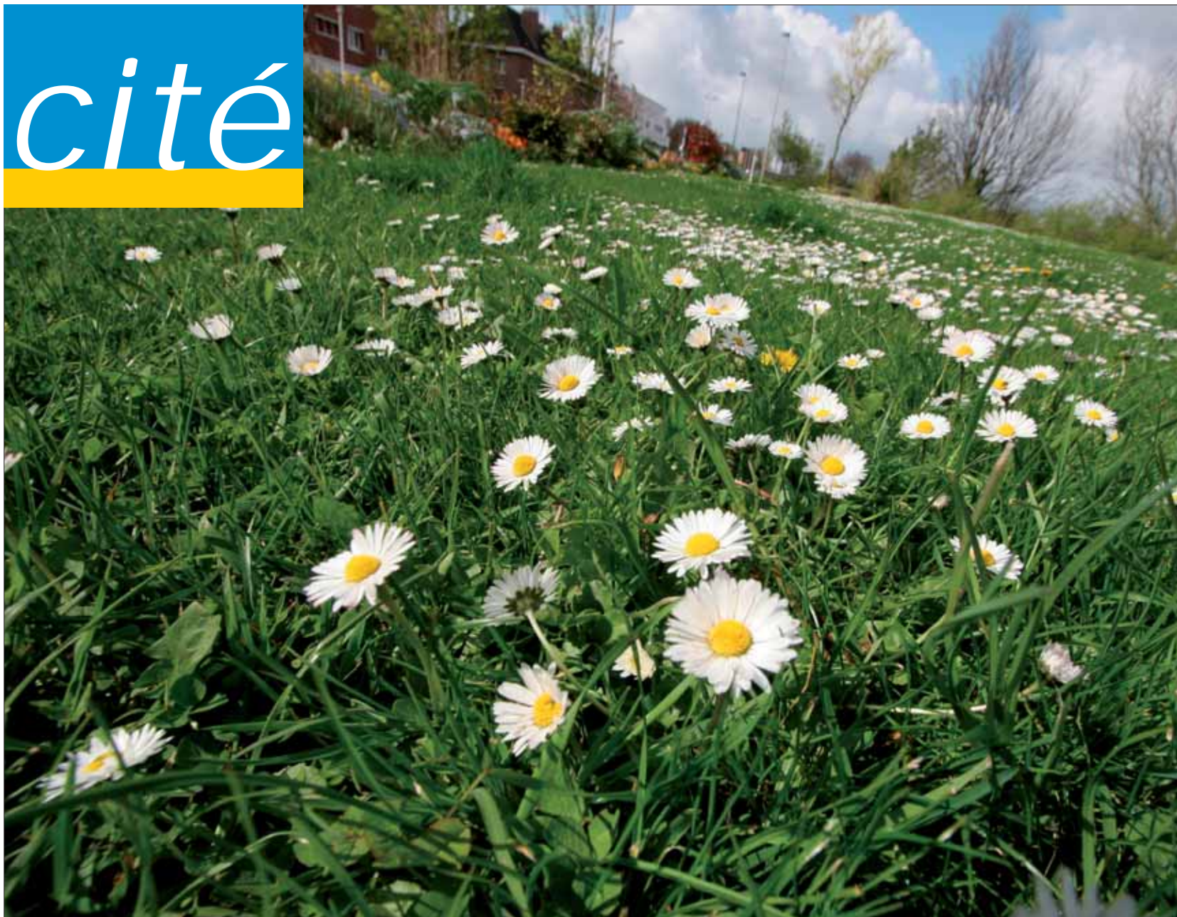
Pâquerettes et pissenlits fleurissent désormais dans les pelouses de la ville.