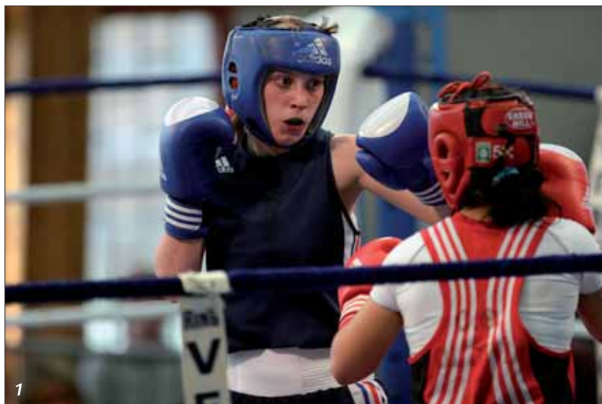
1. Grande-Synthe accueille de nombreux stages et compétitions de boxe féminine.