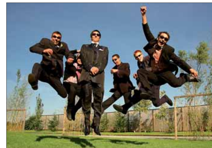
Le groupe Wash out Test ouvrira le bal le vendredi 19 aux 4Écluses.