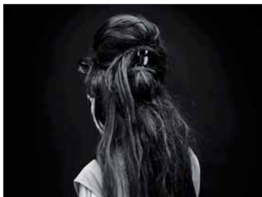
Hedi Slimane, Amy, Untitled, 2007. Coll. Frac Nord-Pas de Calais

Le Frac et le LAAC présentent jusqu'au 5 juillet des œuvres issues de leurs collections sur le thème du désir dans vingt lieux inattendus de Dunkerque.