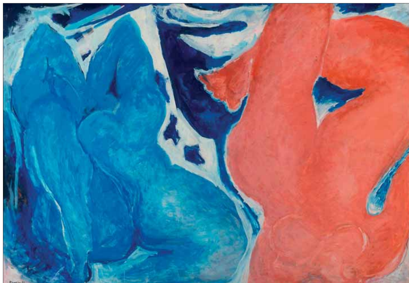
Edouard Pignon, Le Nu à la femme rose, 1980. Coll. LAAC © ADAGP, Paris 2009.