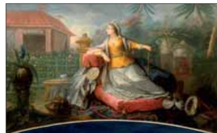
L'Asie