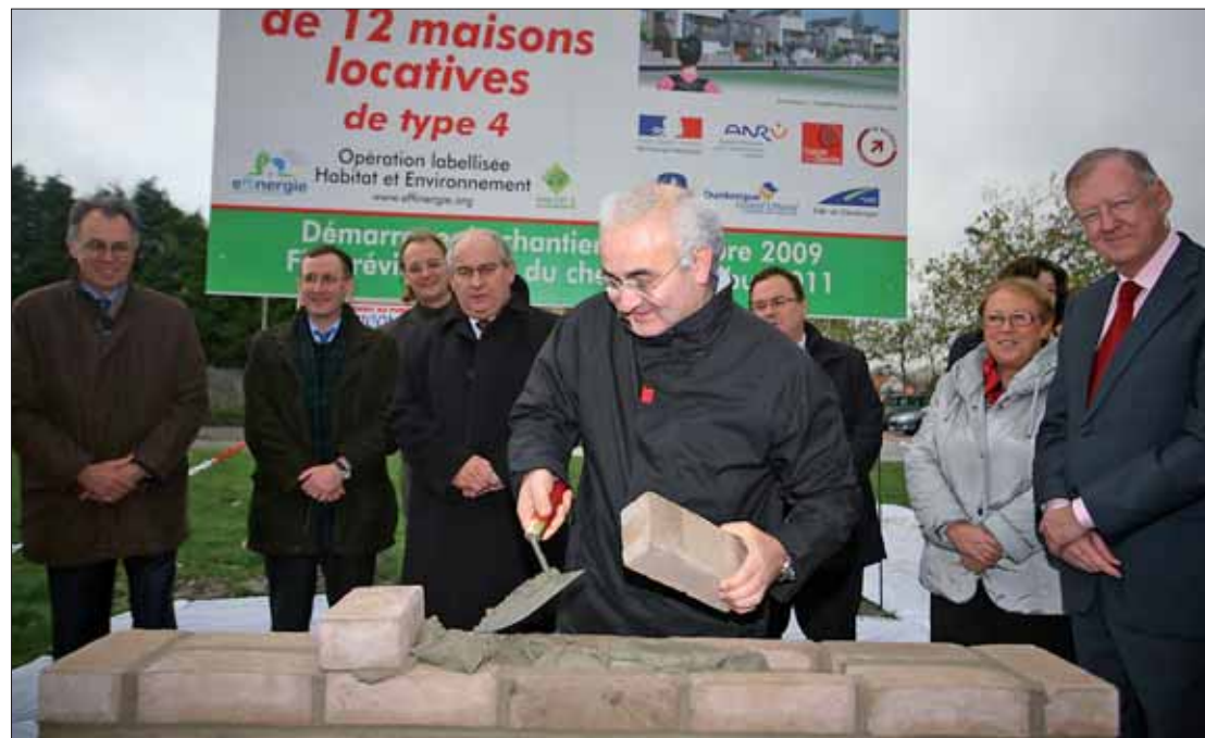
Après la signature des conventions à l'hôtel de ville, les élus se sont déplacés à Petite-Synthe pour poser la première pierre du premier programme de logements neufs du quartier du Grand Large.

Le 12 novembre à l'hôtel de ville, Michel Delebarre, député, maire de Dunkerque, a lancé officiellement aux côtés des partenaires de l'opération (1) le projet de rénovation urbaine du Banc Vert et des quartiers d'habitat ancien (Basse Ville, Soubise et Gare) qui couvre la période 2009-2014. Concernant le Banc Vert à Petite-Synthe, il s'agit d'ouvrir ce quartier vers le secteur Louis XIV en aménageant de nouvelles voiries, et de construire une centaine de logements de qualité en accession sociale ou en location. Même s'il s'agit là aussi de privilégier la mixité sociale, le contexte est un peu différent pour les quartiers d'habitat ancien qui comptent un fort volet de logements privés et de logements pour certains dégradés. Plusieurs opérations sont d'ores et déjà programmées: la réhabilitation des résidences Verrerie, la démolition du bâtiment 5 en Basse Ville en partie compensée par la construction d'une résidence sur l'îlot Saint-Matthieu-Sauvage, la démolition-reconstruction du HBM Charles Valentin, la mise en œuvre d'une opération d'amélioration de l'habitat (OPAH-RU) et d'une opération de restauration immobilière qui concerneront au total 200 loge-