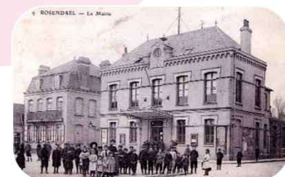
La première mairie de Rosendaël.