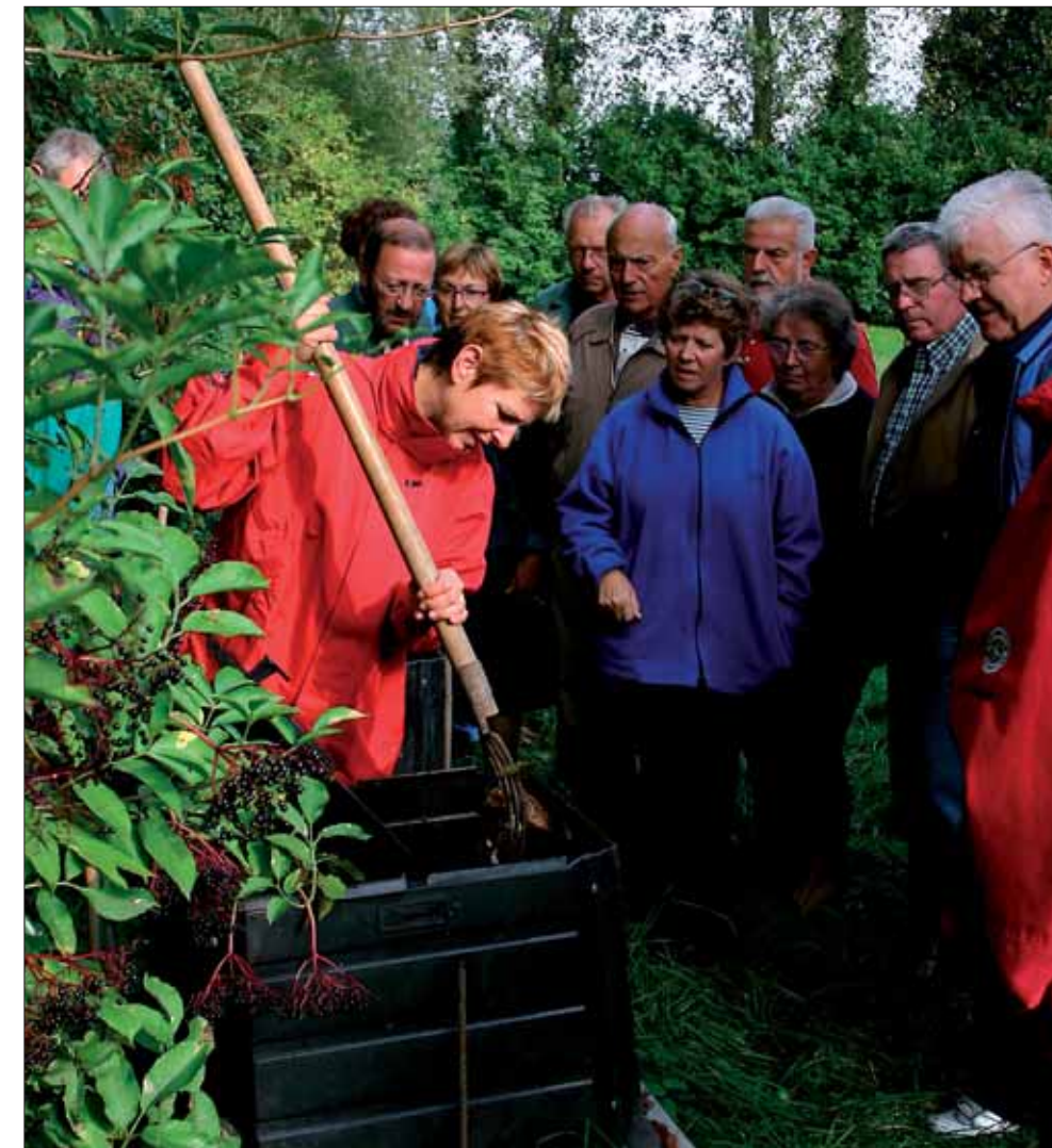
Les futurs utilisateurs de composteurs seront accompagnés par la CUD dans leur démarche écologique.

Le compostage est un procédé naturel qui permet aux matières organiques (déchets de cuisine et de jardin) de se décomposer sous