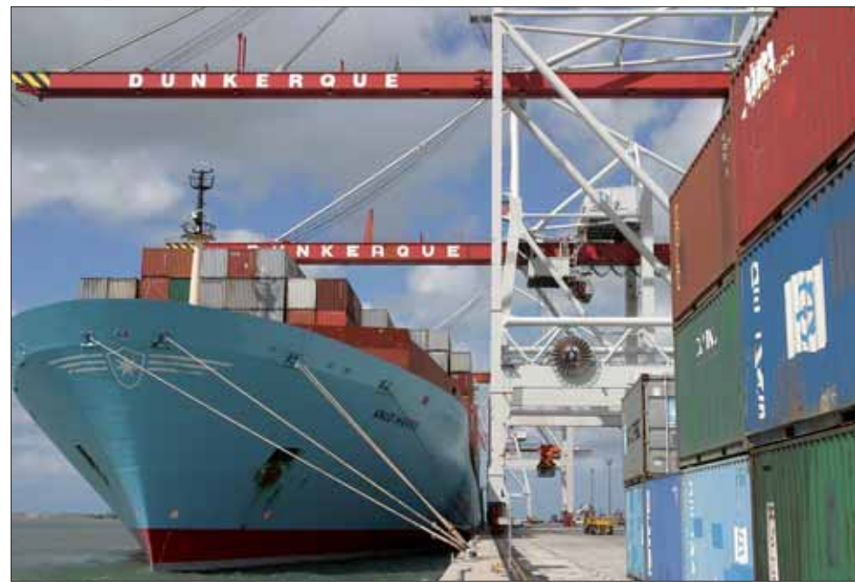
CMA-CGM, à travers sa filiale Terminal Link, a acquis les 30 % détenus jusqu'alors par Interfer-

Après s'en être vu confier la direction en 2005, la société APM Terminals, filiale du géant danois AP Moller-Maersk, a signé le 2 novembre dernier le rachat de 61 % des actions du terminal à conteneurs, devenant ainsi son actionnaire majoritaire. APM Terminals, leader mondial avec plus de 24 millions de conteneurs traités l'an dernier, assure la gestion opérationnelle du terminal dunkerquois jusqu'en 2034. Le Port autonome reste cependant actionnaire avec 9 % des actions, tandis que le groupe français