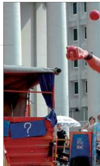
P'tit Bras dans un spectacle plutôt costaud.

Les samedi 19 et dimanche 20 août, après un déjeuner en famille ou mieux encore un pique-nique à la plage, allez donc vous promener sur la digue de Malo-les-Bains ou à Bray-Dunes. Au détour d'une rue ou d'une place, vous pourriez bien rencontrer des êtres irréels ou dé-