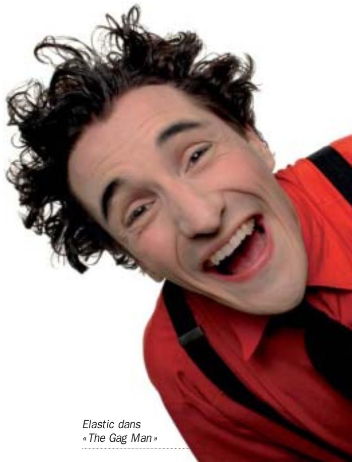
Elastic dans « The Gag Man »