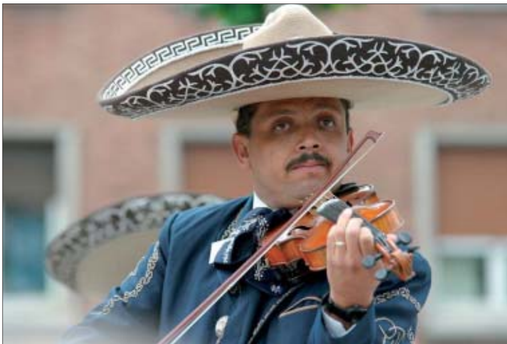
Le Mexique à l'honneur le dimanche 16 juillet.

D ix-sept groupes, une cinquantaine de concerts et une trentaine d'animations déambulatoires, le Festival des folklores du monde qui se déroulera du 7 au 15 juillet à Bray-Dunes, place Rubben, et dans une vingtaine de villes partenaires s'annonce cette