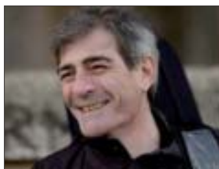
Gabriel Yacoub, vendredi 21.

Pour la cinquième année, le Bois Galamé à Loon-Plage va résonner d'un florilège de musiques traditionnelles. En guest stars, les organisateurs vous proposent un tandem de choc avec le mythique groupe Tri Yann et Gabriel Yacoub (leader du groupe Malicorne). Chants bretons, ballades irlandaises, refrains auvergnats ou flamands, Het Lindeboom joue crânement la carte de l'authenticité et du terroir.