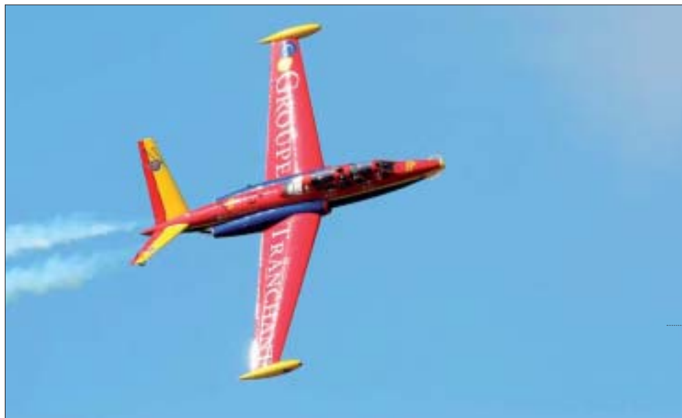
La patrouille de voltige Tranchant Fougas Magister

Au programme : des baptêmes de l'air sur avions de tourisme ou de voltige les samedi de 8 h à 20 h et dimanche matin, des spectacles de voltige féminine et d'acrobaties aériennes (trapézistes évoluant sur les ailes de biplans) le dimanche après-midi, une exposition d'avions de collection ainsi que de nombreuses attractions et animations durant tout le week-end. Entrée libre. Possibilité de se restaurer sur place.