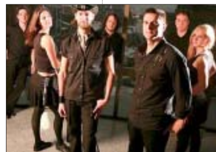
Grand Dérangement, jeudi 20.

deiz et bal folk s'organiseront autour des Léonnes (Dauphins 2005), Emsaverien (Bretagne), Baron-Anneix (Bretagne), Fai-Péta (Auvergne), La Fabrique (Auvergne), Hopland (Flandre) et Twalserée (Flandre).