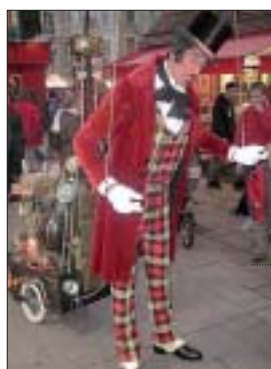
L'incroyable automate à vapeur «Jean-Martin du Verin».

un drôle d'automate à vapeur (15h30 rue Belle Rade et 17h30 digue des Alliés). À 16 h, la compagnie Heyoka s'installera quant à elle place du Centenaire pour « Tête de pioche », un chantier de construction sur lequel s'enchaînent les catastrophes. Enfin, les membres d'Utopium Théâtre reviendront avec leur escarpin géant à 18h30 au niveau de la rue Belle Rade.