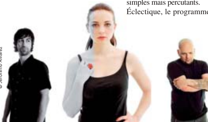
Les Espagnols de Marlango le 12 juillet à Calais.