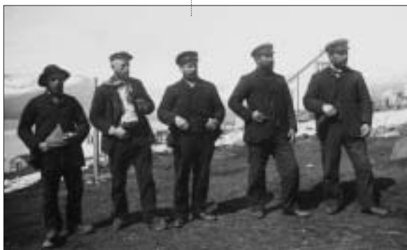
Cinq capitaines de Dunkerque posent pour la postérité en 1908.

Des animations pour les petits : Les « jeunes pêcheurs » pourront emprunter quelques accessoires à l'entrée de l'exposition pour vivre pleinement l'aventure. Ils auront pour mission d'accomplir les différentes tâches nécessaires au succès d'une campagne de pêche.