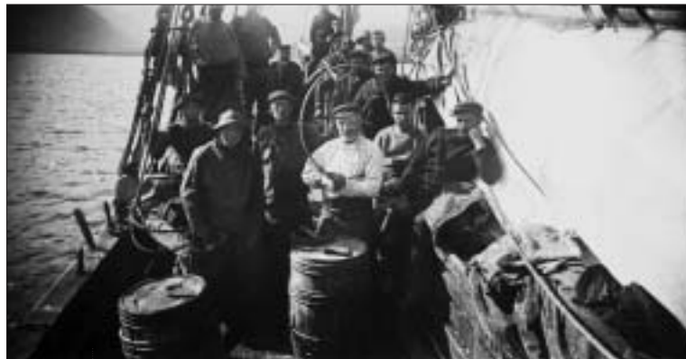
Le tonnelier joue un rôle essentiel pour la conservation de la pêche.

Découvrez le quotidien des marins embarquant pendant six mois pour la pêche à Islande à l'occasion de l'exposition « Pêcheurs d'Islande, une vie sans printemps ». Vivez cette véritable évocation de la pêche telle qu'elle a été pratiquée par les marins de Boulogne-sur-Mer à Bray-Dunes pendant deux siècles et qui a pris fin en 1938. L'exposition s'articule autour des recherches que Jean-Pierre Mélis