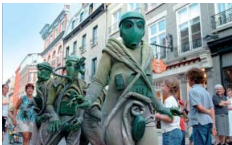
Les quatre extraterrestres du «Projet Globule Vert».

pe Histoire de famille interprétera vos chansons préférées grâce à un juke-box géant, à moins que vous ne préférerez suivre les aventures de la Mékanibulle, une étrange