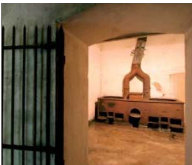
4. Courtines 32-5 : un musée dédié à la bataille de Dunkerque.