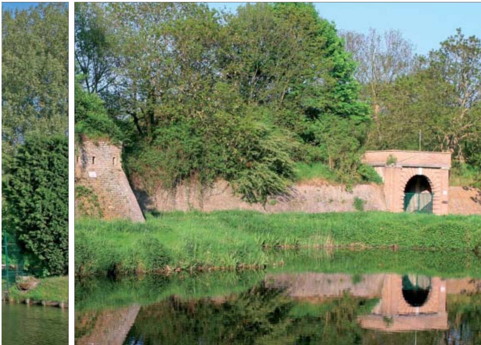
Derniers vestiges des fortifications de Vauban, le Fort Louis (1) et le Fort Vallières (2) sont aujourd'hui des lieux de promenade appréciés de tous.