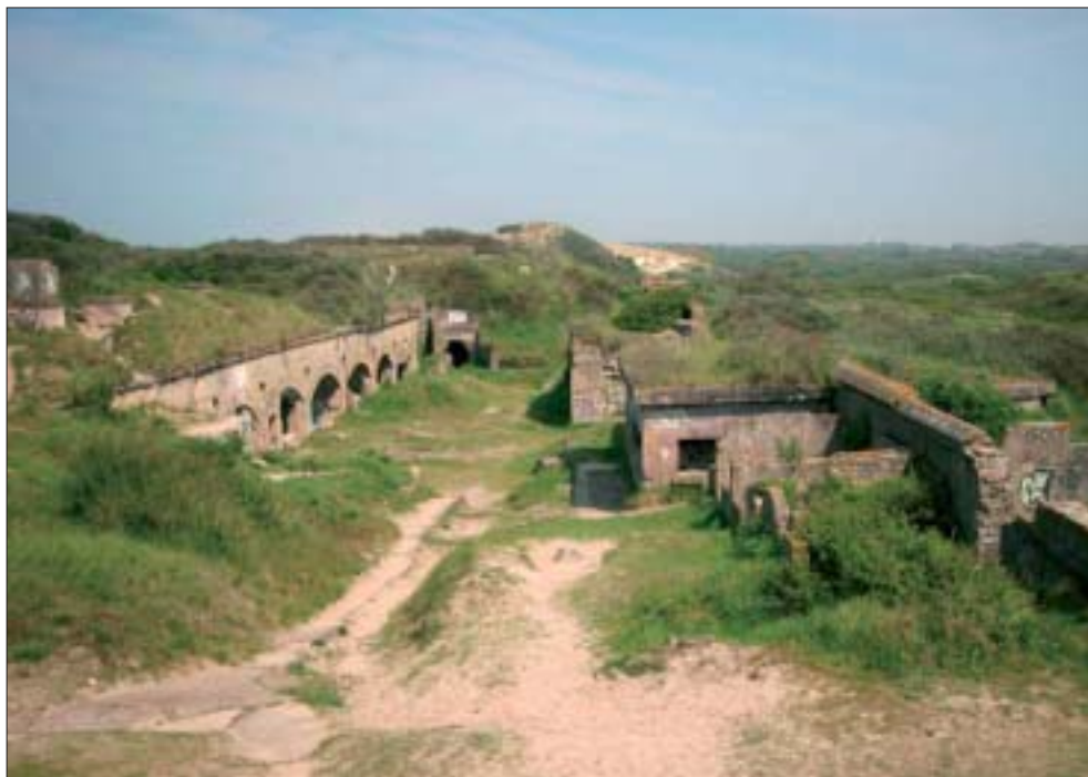
1. Fort des Dunes : Les casemates de la cour principale.