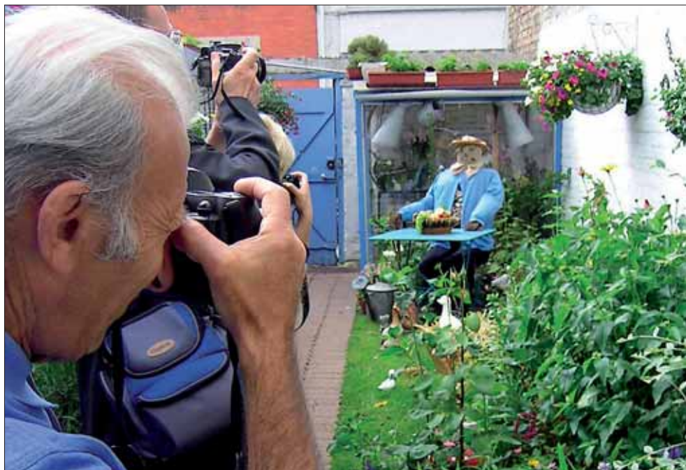
L'atelier photo de la MJC est cours de labélisation.