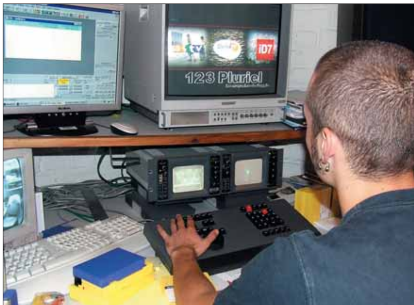
« 1,2,3 Pluriel » est diffusée chaque semaine sur le réseau Numéricable.

Le magazine audiovisuel de la Ville ID 7 et les chaînes de télévision locale Delta TV à Gravelines et l'ASTV basée à Grande-Synthe ont décidé de s'associer autour d'une nouvelle émission intitulée « 1,2,3... Pluriel ». Objectif : présenter des reportages des trois chaînes touchant l'ensemble des habitants de l'agglomération. Diffusée auprès de 50 000 foyers des trois réseaux aujourd'hui connectés, cette émission hebdomadaire d'environ 15 à 20 minutes prolonge et concrétise les échanges et la coopération technique qui existent déjà depuis plusieurs années entre ces télévisions locales. Mais si « 1,2,3... Pluriel » s'articule autour de reportages axés sur le développement de l'agglomération, les trois télévisions conservent cependant leurs propres émissions, au plus près de la population. Des fêtes de quartier au projet du Grand Large, retrouvez chaque semaine ID7 sur le réseau Numéricable. ◆