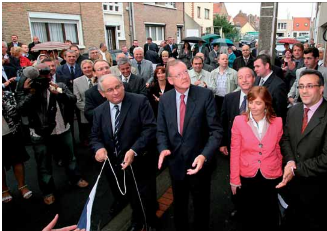
Michel Delebarre, député-maire et Jean-Régis Borius, sous-préfet ont inauguré le 25 septembre l'antenne de

Il s'agit dans les faits d'une véritable réorganisation des acteurs locaux de l'accès à l'emploi et à la formation avec la présence en un même lieu de référents d'Entreprendre ensemble (Plan local pour l'insertion et l'emploi), de la Mission locale, de l'ANPE, du CCAS et de l'Aduges. De plus, le public aura accès dans les antennes à l'offre de services de l'Assedic. Ainsi, par exemple, un demandeur d'emploi qui souhaitait avoir un contact avec l'Assedic devait soit se déplacer à Coudekerque-Branche ou à Grande-Synthe, soit se connecter sur Internet à domicile.