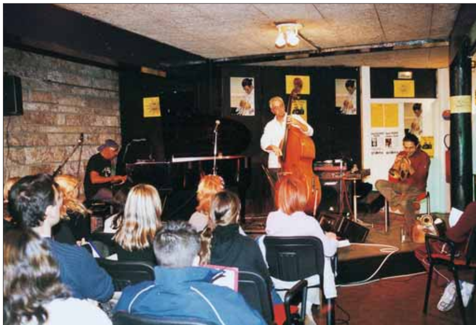
Le Jazz-Club organise des master-classes ouvertes aux particuliers.

Nouveauté cette saison, le Jazz-Club se propose d'ouvrir au public les portes du nouveau lieu musical mis à sa disposition par la Ville au Pôle Marine. Durant une semaine, de jeunes groupes d'amateurs éclairés sont invités à venir profiter de l'encadrement technique du Jazz-Club. Une aide à la création ponctuée le samedi par un concert donné