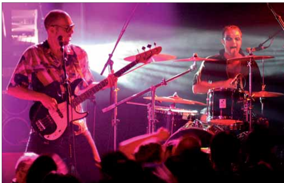
Les 4Écluses, lieu de diffusion mais également de soutien technique des groupes.

Autre accompagnement mis en place par les 4Écluses, les répétitions encadrées. À la demande, des groupes ou des artistes solos peuvent bénéficier, sur des périodes d'un à quatre jours, de l'encadrement du technicien du son de la structure ou d'intervenants extérieurs. La saison dernière, 32 musiciens ou techniciens ont été concernés sur un total de 18 jours. À ceux-ci s'ajoutent les formations qui se produisent en première partie de programmation des 4Écluses et qui bénéficient dans ce cadre d'un accompagnement technique : ce fut le cas en 2005-2006 pour 88