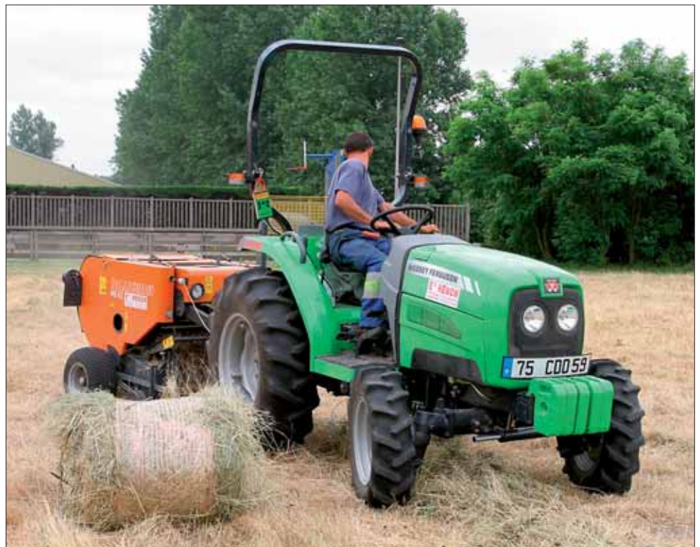
Le service des espaces verts a acquis une enrubanneuse fin 2005.

tries pharmaceutiques...), l'objectif étant de préparer au mieux son insertion professionnelle. Par ailleurs, si les écoles de commerce sont réputées pour leur savoir-faire, elles le sont aussi pour leur coût d'inscription. C'est pourquoi l'ISCID met en place une commission de suivi social pour permettre à des élèves méritants aux revenus modestes d'intégrer ses formations. ♦