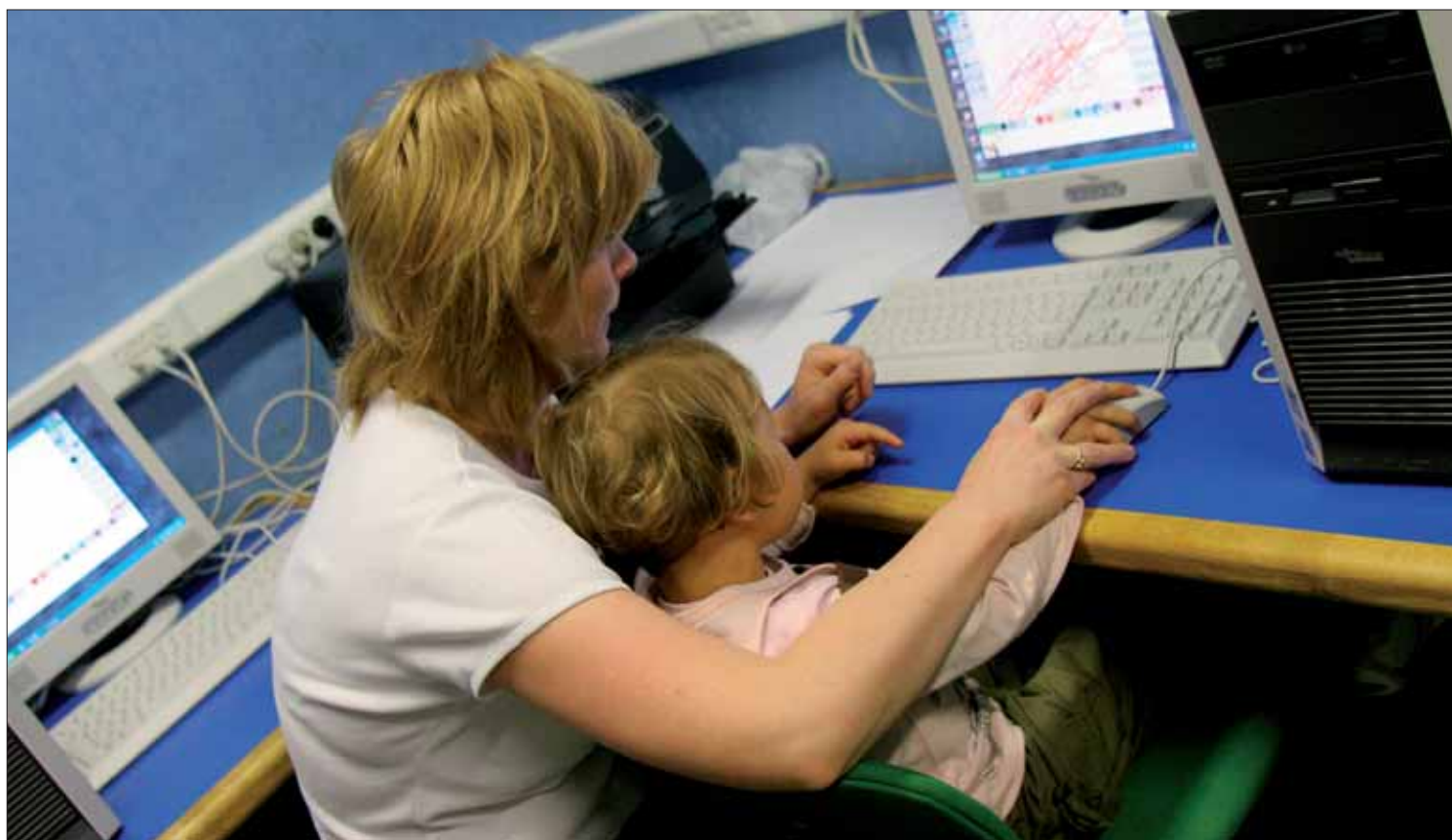
Un atelier informatique vient d'ouvrir ses portes à la halte-garderie de la Basse Ville.

Maison de quartier de la Basse Ville, 49 rue de la Paix. Tél. 03 28 64 21 10. D'autres haltes-gardiennes sont ouvertes, à horaires variables, dans les maisons de quartier du Pont Loby, Pasteur, Jeu de Mail, Soubise, Glacis, Rosendaël-Centre et Méridien. Renseignements au 03 28 59 08 04.