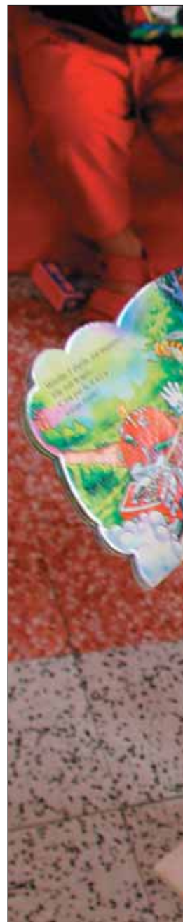
La crèche collective des Glacis accueille des enfants âgés de 10 semaines à 3 ans.