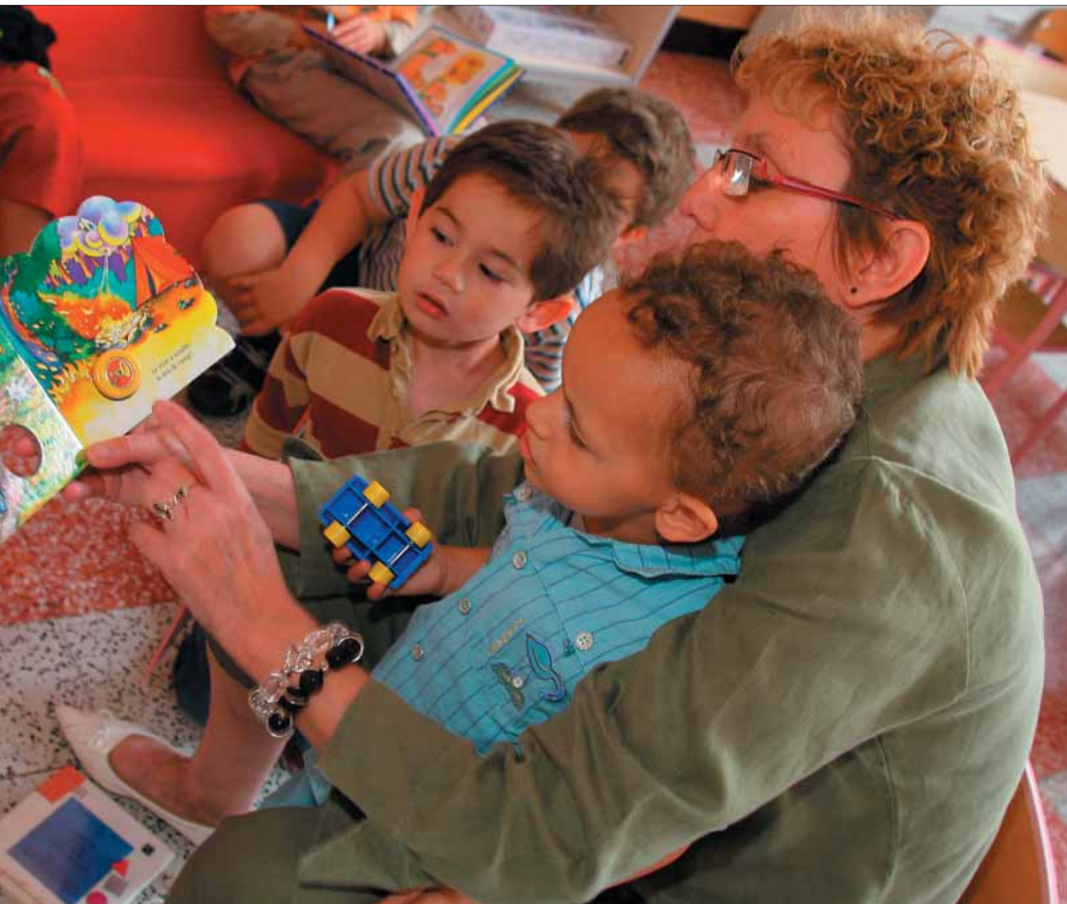
L'espace périscolaire Paul Bert, un lieu de vie avant et après la classe à Rosendaël.