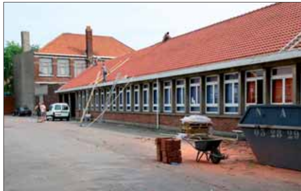
Les agents techniques municipaux ont remplacé la toiture du bâtiment annexe de l'école Trystram.

Les services techniques sont également intervenus dans les équipements sportifs municipaux. La piscine et la salle de sport Deleersnyder bénéficient désormais d'un accès pour les personnes à mobilité réduite, et les douches du bassin d'initiation sont en cours