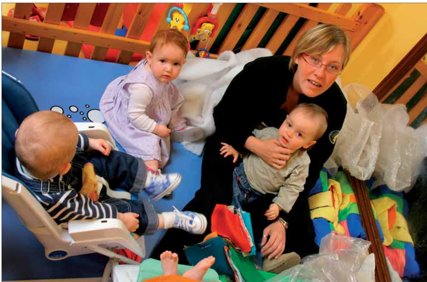
Le multi-accueil du Banc Vert offre un service de crèche et de halte-garderie.