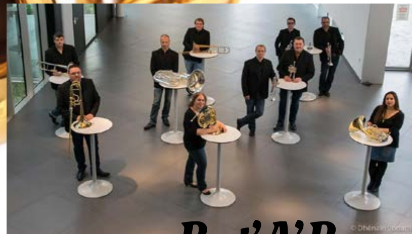
Ensemble de cuivres

Véritable bouquet final du festival, ce concert vous propose de découvrir des œuvres de César Franck, Alexandre Guilmant et Léon Boëllmann .