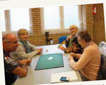
Un concours de belote pour le plaisir