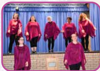
↑ Notre groupe Dynamic Dance a été très applaudi