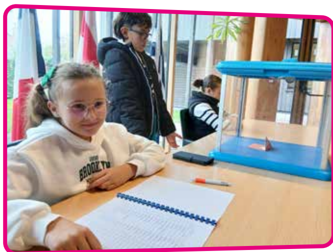
↑ De vraies élections en bonne et due forme !

Former nos enfants à la citoyenneté, connaître leurs besoins, les impliquer dans la vie de la cité, sont autant de raisons pour lesquelles ce conseil a été institué en 2000. La participation au Conseil Municipal d'Enfants prépare les jeunes citoyens à la vie d'adulte. Elle leur permet d'acquérir des connaissances et une ouverture d'esprit qui leur seront utiles dans la vie personnelle et professionnelle.