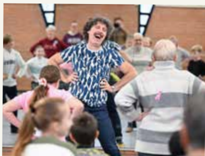
«Jouer à danser» avec les enfants du CME