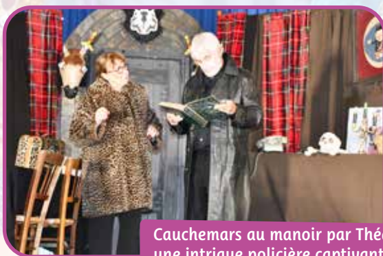
Cauchemars au manoir par Théadra, une intrigue policière captivante !