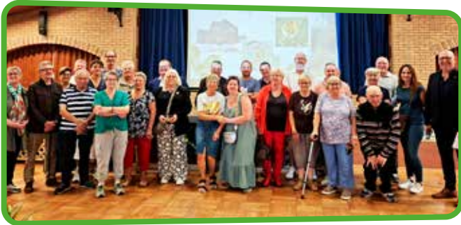
↑ Félicitations à tous nos lauréats

Les participants au concours des jardins fleuris 2025 ont été mis à l'honneur lors de la réception organisée le 19 septembre dernier.