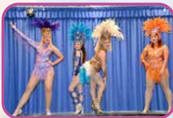
↑ Plumes et paillettes... Amazone dance nous a fait voyager au rythme des danses brésiliennes