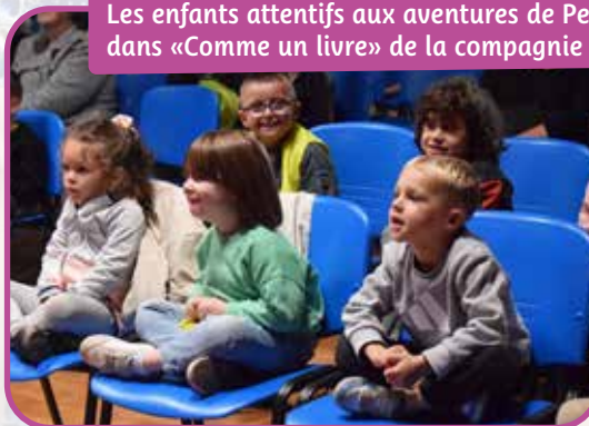
Les enfants attentifs aux aventures de Petit Jean dans «Comme un livre» de la compagnie Mariska