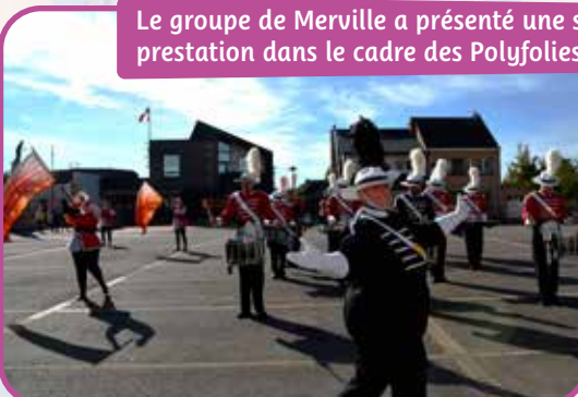
Le groupe de Merville a présenté une superbe prestation dans le cadre des Polyfolies