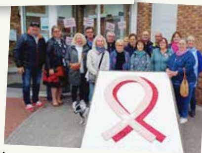
Les participants à la marche en bleu sont solidaires d'Octobre rose