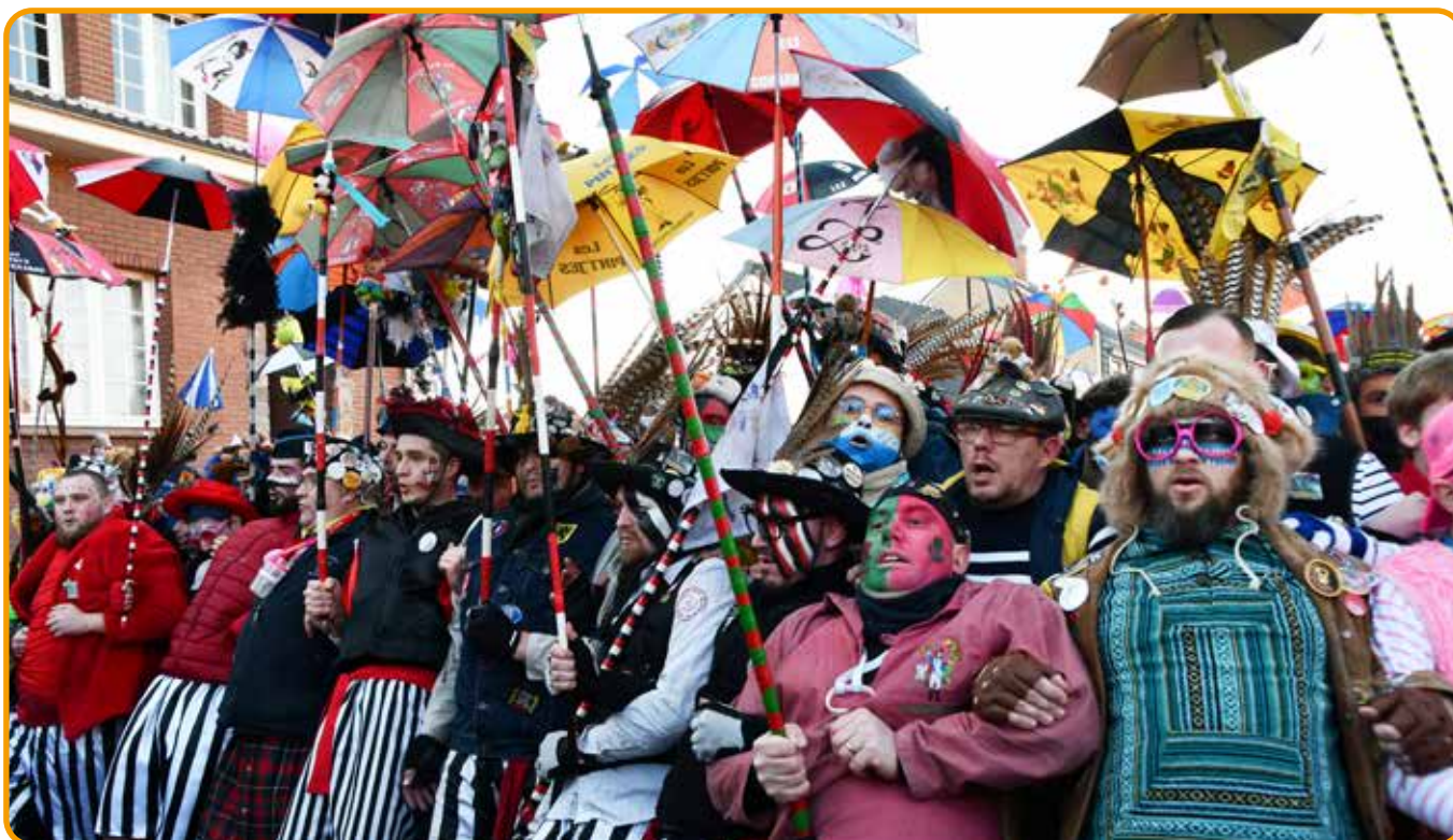
↑ Les masquelours pourront s'en donner à cœur joie !

Le samedi 24 janvier , l'association les Zootenards organisera son Bal enfantin à la salle des Fêtes de 14h30 à 18h30