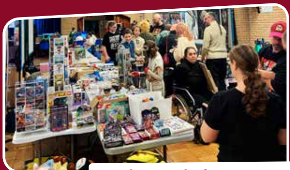
Un salon pour des fans FANTASTYK !