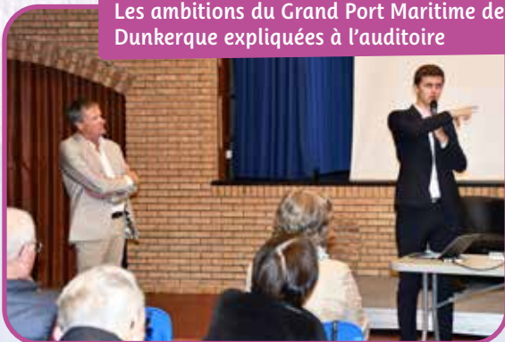
Les ambitions du Grand Port Maritime de Dunkerque expliquées à l'auditoire