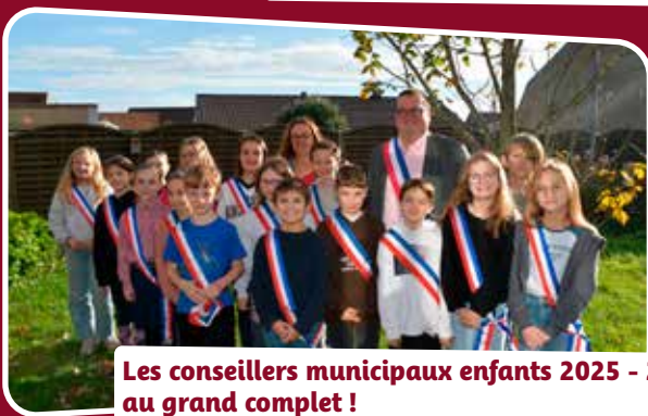
Les conseillers municipaux enfants 2025 - 2026 au grand complet !