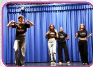
↑ L'association Adam School de Petite-Synthe a participé de façon dynamique à la soirée