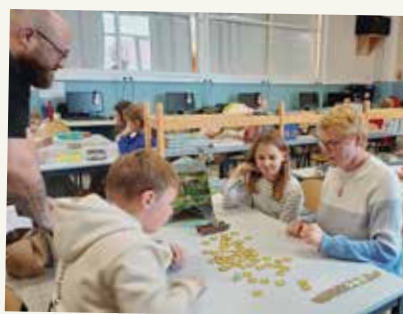
Jeux de société avec les scolaires