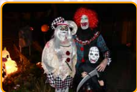
↑ Des visiteurs qui jouent le jeu à fond !

Rendez-vous en 2026 pour de nouvelles surprises !