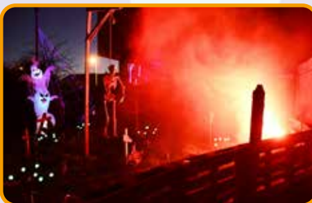
↑ Ambiance terrifiante sur l'hôtel de ville