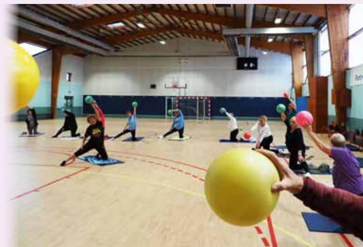
↑ La gymnastique tout en douceur

La Semaine bleue dédiée aux aînés a été l'occasion de rappeler toute la place qu'occupent nos seniors dans la vie de notre commune. Les activités, échanges et moments conviviaux ont permis de favoriser le lien intergénérationnel et de lutter contre l'isolement.