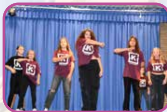
↑ Les jeunes du Collectif ont mis Fort-Mardyck en rythme !