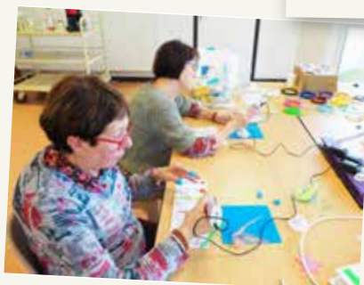
Atelier pour booster sa créativité