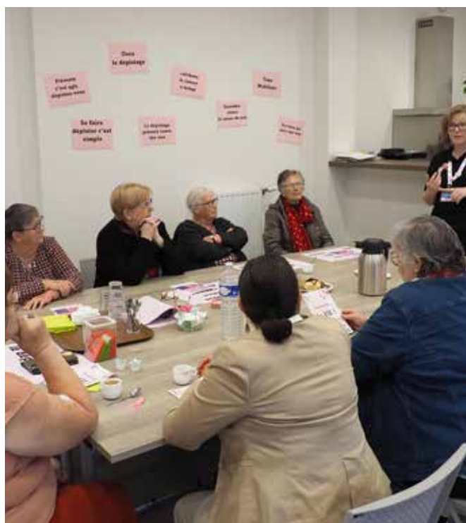
↑ Action de prévention animée par l'association au-delà du cancer le 9 octobre à la Maison de la Solidarité