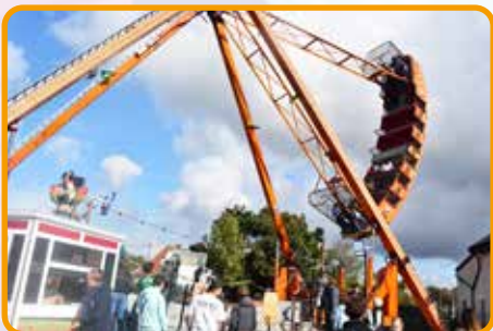
↑ Que vogue le bateau pirate !

nouvelle attraction, « le Bateau Pirate », qui était installée face au centre social. Ce temps fort du début de l'automne continue d'attirer beaucoup de monde et reste la deuxième fête foraine la plus importante de l'agglomération Dunkerquoise après celle de Dunkerque.