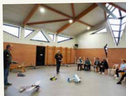
Séance d'initiation à l'aéromodélisme