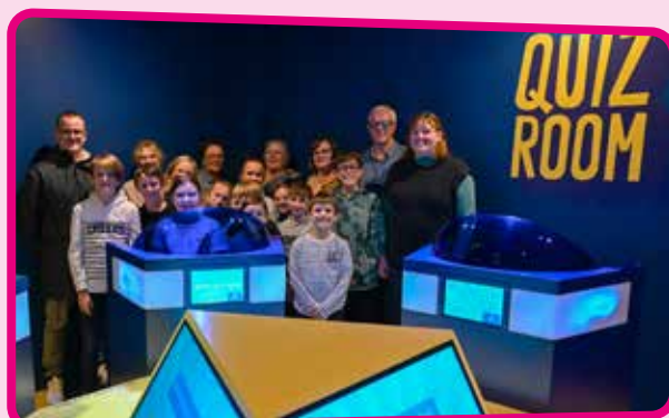
↑ Un beau moment de partage de connaissances entre générations

Le mercredi 15 octobre, cap sur Dream In Park à Grande-Synthe pour un super quizz intergénérationnel. Six équipes, réunissant jeunes et seniors, se sont affrontées autour de questions de culture générale dans l'ambiance d'un véritable jeu télévisé. Les buzzers ont résonné à de nombreuses reprises dans la salle, les rires fusaient, et chacun est reparti le sourire aux lèvres. L'après-midi s'est clôturée autour d'un goûter convivial à la Maison de la Solidarité.