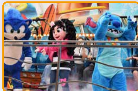
↑ Les mascottes ont fait le show !!