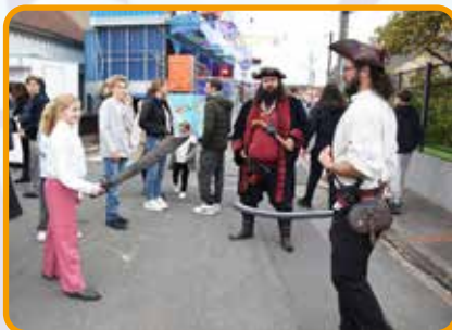
↑ Des animations autour de la piraterie sur le parcours de ducasse