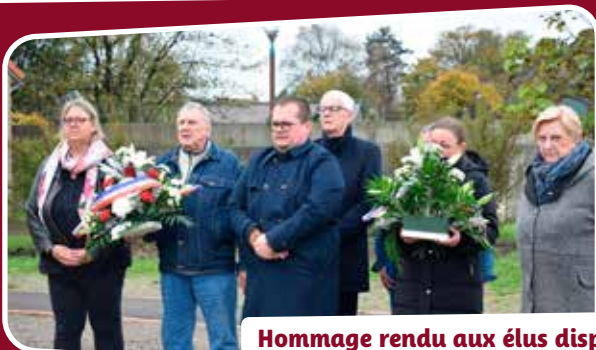
Hommage rendu aux élus disparus à l'occasion de la Toussaint