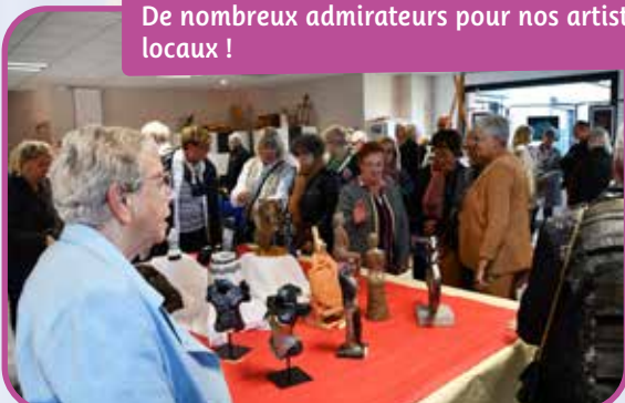
De nombreux admirateurs pour nos artistes locaux !