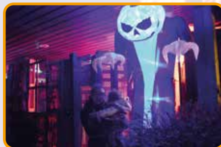
↑ Malgré la menace qui pèse, certains restent détendus