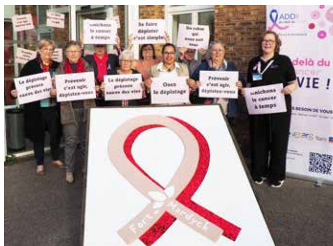
↑ Ensemble contre le cancer

En vous mobilisant à nos côtés que ce soit en participant aux événements, en portant un ruban rose ou simplement en en parlant autour de vous, vous avez contribué à sauver des vies.