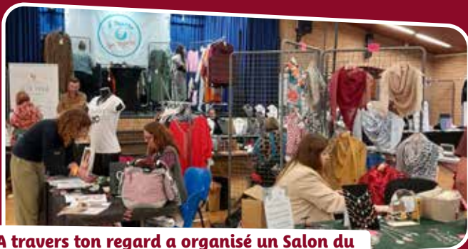
A travers ton regard a organisé un Salon du Bien-être qui a connu un vif succès