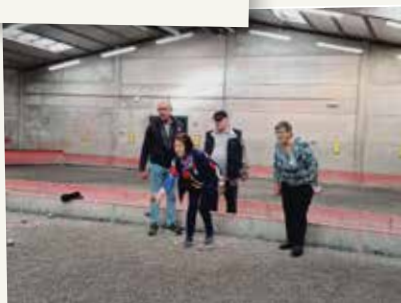
Concours de pétanque avec l'association Pétanque Fort-Mardyck