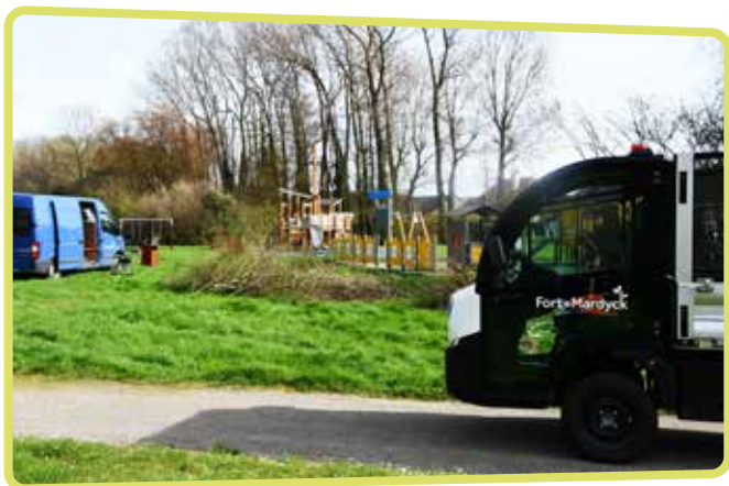
↑ Des aires de jeux entretenues pour votre confort

Après les vacances de Toussaint et jusqu'aux vacances de printemps, les aires de jeux de la commune (Square des enfants, Ile aux jeux et City Stade) seront fermées au public pour des raisons d'entretien annuel. En effet, nos services vont profiter de la période hivernale pour mener à bien tous les travaux nécessaires au confort et à la sécurité des usagers des aires de jeux : nettoyage, taillage des végétaux, rénovation des sols souples, maintenance des jeux pour enfants ... Ainsi, au printemps prochain, les familles et les enfants pourront bénéficier des aires de jeu en toute quiétude ... et d'un nouvel équipement à l'île aux jeux ; une maisonnette avec un toboggan pour les plus petits !