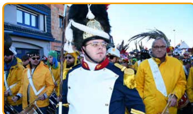
↑ Krampeut' mènera sa clique dans les rues de la commune le 17 janvier 2026