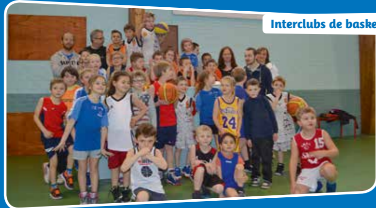
Interclubs de basket