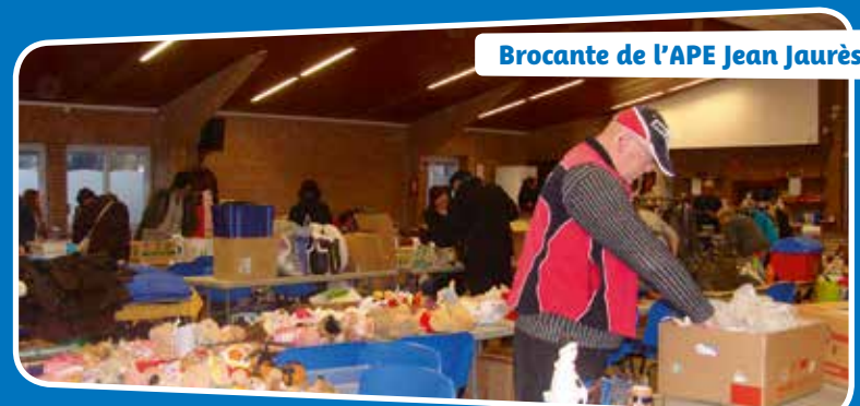
Brocante de l'APE Jean Jaurès