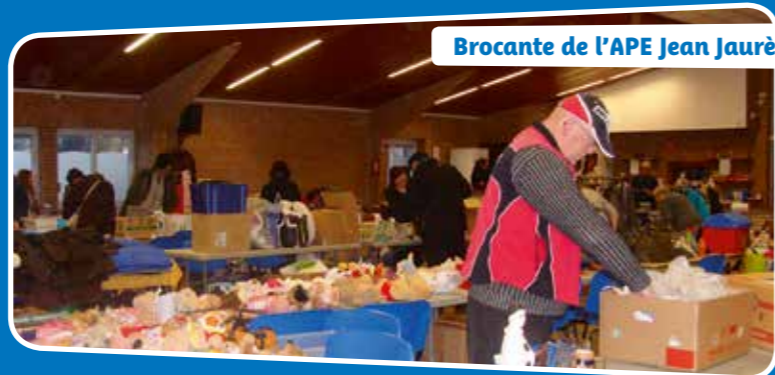
Brocante de l'APE Jean Jaurès