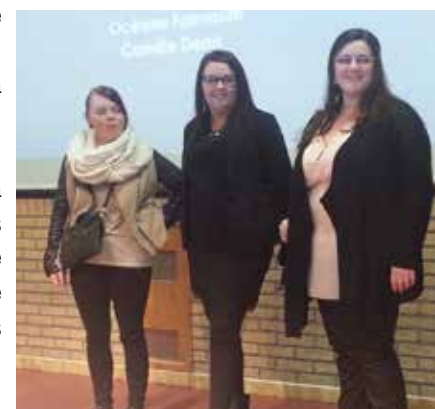
† Les animatrices de l'Etoile du Marin.