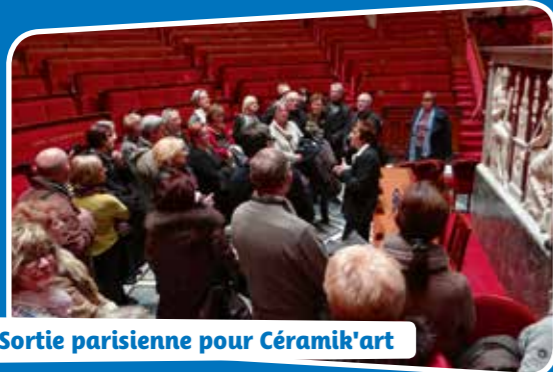
Sortie parisienne pour Ceramik'art