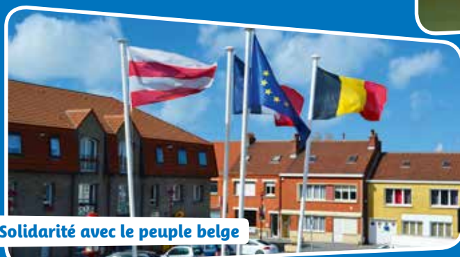
Solidarité avec le peuple belge

La commune de Fort-Mardyck a tenu à manifester sa solidarité avec le peuple belge consécutivement aux attentats qui ont frappé Bruxelles, le 22 mars.