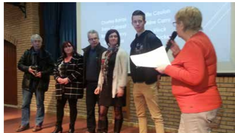
Les encadrants et bénévoles du FMOC Basket.

La commune compte une trentaine d'associations qui rassemblent près de 200 bénévoles. Parce qu'au quotidien ces bénévoles encadrent des jeunes à qui ils enseignent un sport, inculquent un art ou transmettent des valeurs, ils ont été mis à l'honneur : les encadrants du FMOC football, les animatrices du CLIC gym, les animatrices de l'Etoile du marin, les encadrants du FMOC basket, les animateurs du CLIC tennis, les animatrices de Dynamic Dance, les encadrants du FMOC pétanque et les animateurs du full contact.