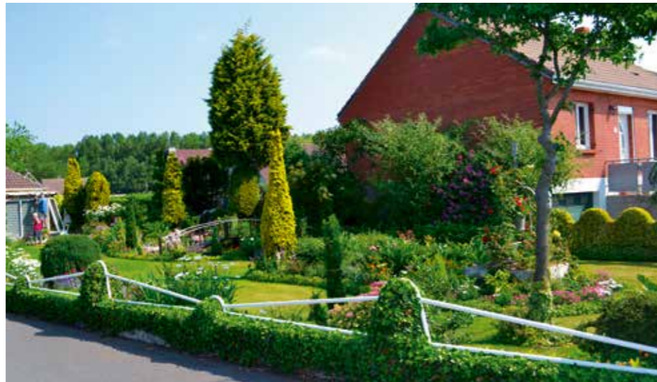
↑ Le jardin d'un des lauréats du concours 2015.

Le concours communal des jardins fleuris existe sous sa forme actuelle depuis plusieurs années. Il ne nécessite pas d'inscription, c'est le jury qui choisit les habitations qui retiennent son attention. S'il va perdurer tel que vous le connaissez, une nouveauté va intervenir pour l'édition 2016. En effet, il sera désormais possible de participer à un challenge. Les personnes qui souhaitent concourir devront s'inscrire en mairie entre le 1 er et