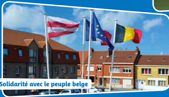
Solidarité avec le peuple belge

La commune de Fort-Mardyck a tenu à manifester sa solidarité avec le peuple belge consécutivement aux attentats qui ont frappé Bruxelles, le 22 mars.