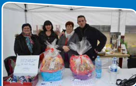
Collecte au profit des Restos du Cœur