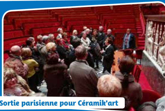
Sortie parisienne pour Céramik'art