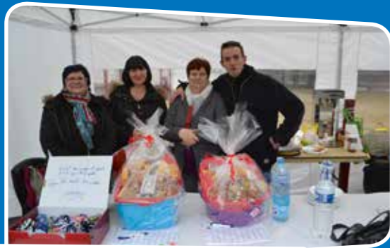
Collecte au profit des Restos du Cœur