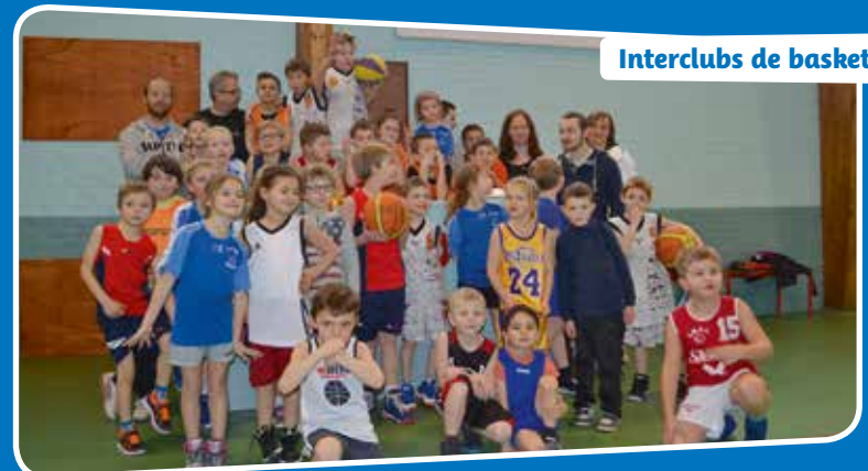
Interclubs de basket